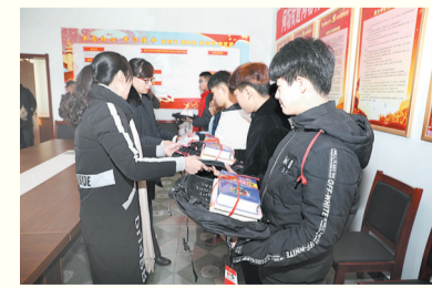
惠民县公路管理局第一党支部

邹平市妇女联合会党支部通过聚焦队伍建设,凝聚“巾帼先锋”党建之力;强化责任担当,改进“巾帼先锋”党建之风;增强服务意识,提升“巾帼先锋”党建之效;加强阵地建设,夯实“巾帼先锋”党建之基等措施,在巾帼创业、巾帼脱贫等各项工作中,团结协作、默契配合、活力迸发、勇争一流,推进妇女儿童事业不断发展,各项工作取得新成效。