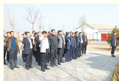
滨州市纪委监委第九机关党支部

滨州市政协第六机关党支部探索总结“四抓四力”工作法,擦亮“党建+”品牌,打造“支部+党小组+先锋岗+示范人”工作体系,积极参与展现新气象、实现新作为“两新”实践活动,参与建“站”设“日”,开创山东省电视协商节目先河的电视访谈类节目——《委员关注》已录制节目42期。