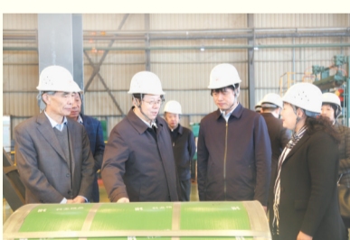
滨州市政协第六机关党支部

滨州市人大常委会第三机关党支部积极探索以党建工作引领立法工作扎实开展的有效途径,结合主题党日活动,深入学习贯彻习近平新时代中国特色社会主义思想和党中央及省、市委重大决策部署,联系支部实际工作,研究探讨做好人大监督和地方性法规起草、修改、调研等各项工作,为更好地做好地方立法工作,积极推进立法流程和立法制度建设。