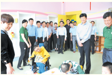
滨州市委组织部第一机关党支部

滨州市纪委监委第九机关党支部立足巡察机构职责任务,以标准化建设为抓手,以“规范、担当、暖心”作为支部党建品牌,充分发挥党支部政治功能,打造政治过硬、作风优良、敢于担当的巡察干部铁军。高质量开展组织生活,全方位关心关注巡察干部队伍,为巡察干部队伍建设提供了实践样本,积累了实践经验。