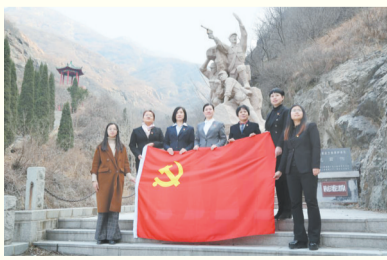
邹平市妇女联合会党支部

滨州市委组织部第一机关党支部秉持“三个提高”“五个带头”工作理念,围绕“富强滨州”建设大局,充分发挥“智囊团”“参谋部”作用,积极打造“精诚辅政”党建品牌。同时,积极进机关、进企业、进农村、进社区、进项目现场等,在近距离、多维度融入中心大局中,不断提升党支部规范化建设水平。