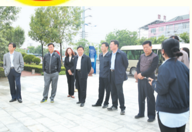
滨州市人大常委会第三机关党支部

滨州市人大常委会第三机关党支部积极探索以党建工作引领立法工作扎实开展的有效途径,结合主题党日活动,深入学习贯彻习近平新时代中国特色社会主义思想和党中央及省、市委重大决策部署,联系支部实际工作,研究探讨做好人大监督和地方性法规起草、修改、调研等各项工作,为更好地做好地方立法工作,积极推进立法流程和立法制度建设。