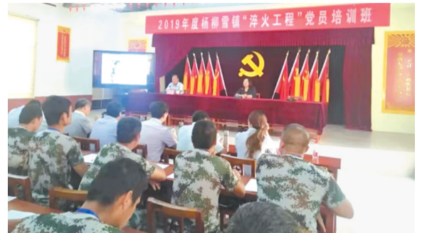
学员听取市委党校专家教授作乡村振兴专题报告。

培训班推选出班委,选举产生了临时党支部,组建了党小组,在校学习、生活期间,以班委、党支部和党小组自我管理为主。在班委和临时党支部的统一领导下,党小组轮流组织分组讨论,交流学习心得体会,相互检查学习笔记,相互监督在校期间的学习生活纪律。每天开展军事队列训练和宿舍内务学习比武,锤炼参训学员服从意识和集体主义观念,切实通过淬火培训凝聚士气、增强党性、提升能力。学员们签订《学以致用任务书》,跟踪问效,督促所有党员以新的境界、新的本领,为红旗杨柳雪的发展作出积极贡献。