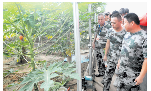
参训学员在龙崖合作社参观木瓜种植大棚。