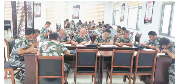
学员分组讨论,写下学习心得体会。