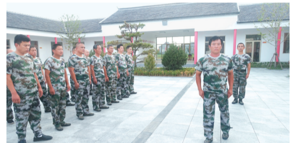
开展军事训练,锤炼参训学员服从意识和集体主义观念。