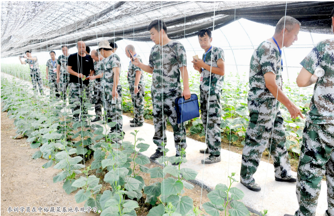
参训学员在中裕蔬菜基地参观学习。

在听取专家、领导授课的基础上,培训班通过参观学习杰出楷模周恩来展、重温入党誓词等方式进行党性锤炼。通过军事训练磨砺品质,撰写心得体会总结提升等多种方式来强化党员意识,使农村党员素质、能力得到进一步提升,切实让“不忘初心、牢记使命”主题教育入脑入心,督促党员党性修养和党的建设不断加强。