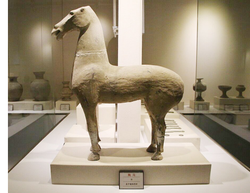
博兴县店子镇利戴村出土陶俑。