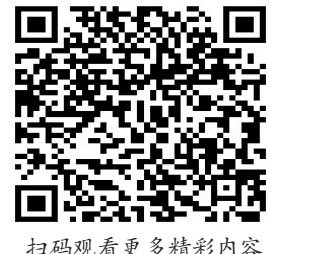
扫码观看更多精彩内容