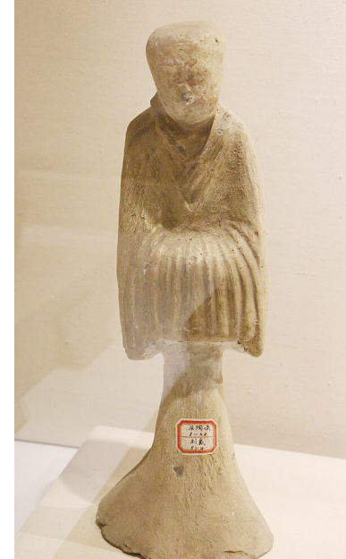
博兴县湖滨镇南村出土仕女俑。