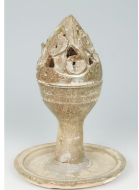
汲家湾汉墓出土博山炉。