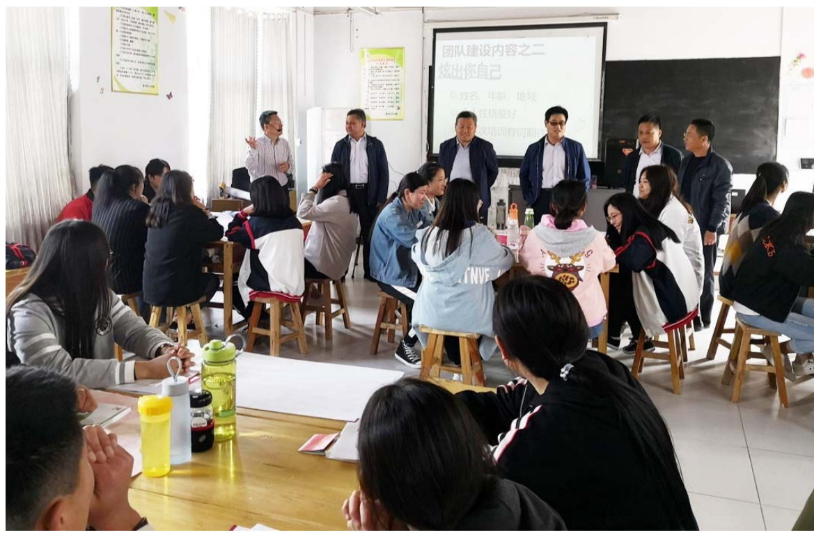
开展大学生创业培训。

员的招募力度，今年惠民县招募计划为24人，为促进服务期满大学生留在基层服务单位就业，进一步完善培养与考评机制，对本人自愿申请转编的“三支一扶”人员，两年后经考察合格，可就地转为事业单位编制人员。