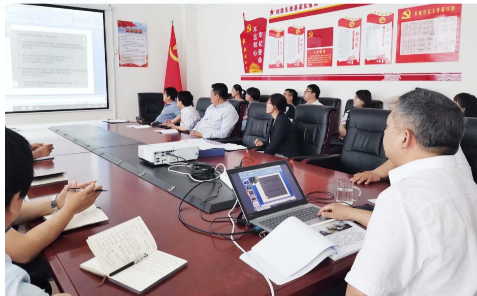
人社大讲堂开讲——党组书记上党课。