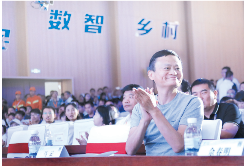
出席峰会主论坛“淘宝惠民 数智乡村”的马云笑容满面。

更激动的事情在后面。马云走进直播间!直播间“爆炸”了!“各位网友大家好,我是马云。愿(农民的)生意越来越好,(网友)买得越来越多,(助农直播)干得越来越好。”他说。