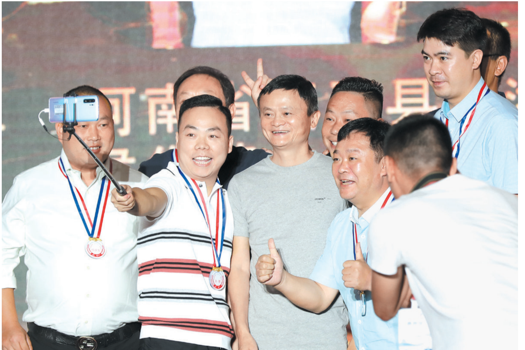
马云与中国淘宝村“十年十人”在会场自拍留念。