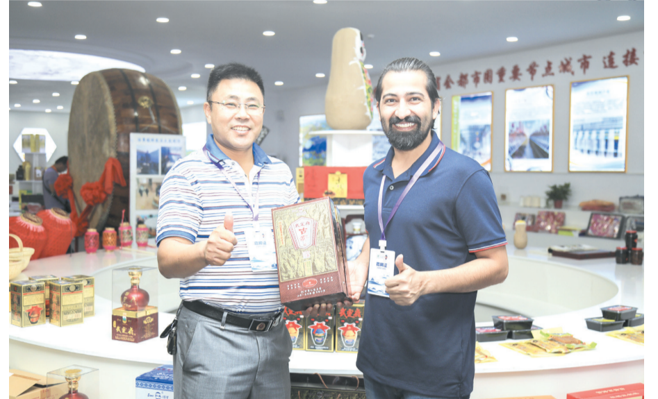
国外嘉宾点赞惠民旅游产品。