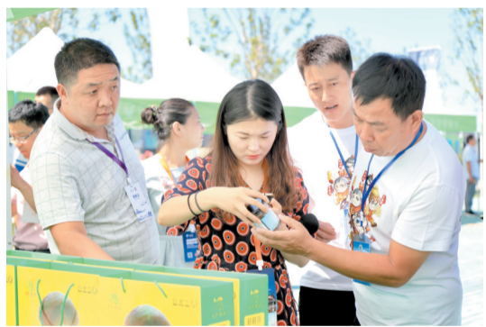
各式各样的菌类产品让嘉宾纷纷驻足。