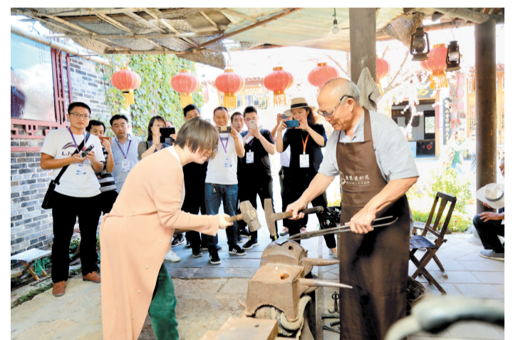
魏集古村落的铁匠铺成为“网红打卡地”。