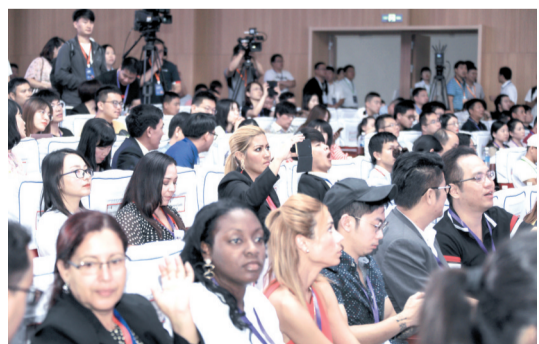
淘宝村高峰论坛汇聚全球各路嘉宾。