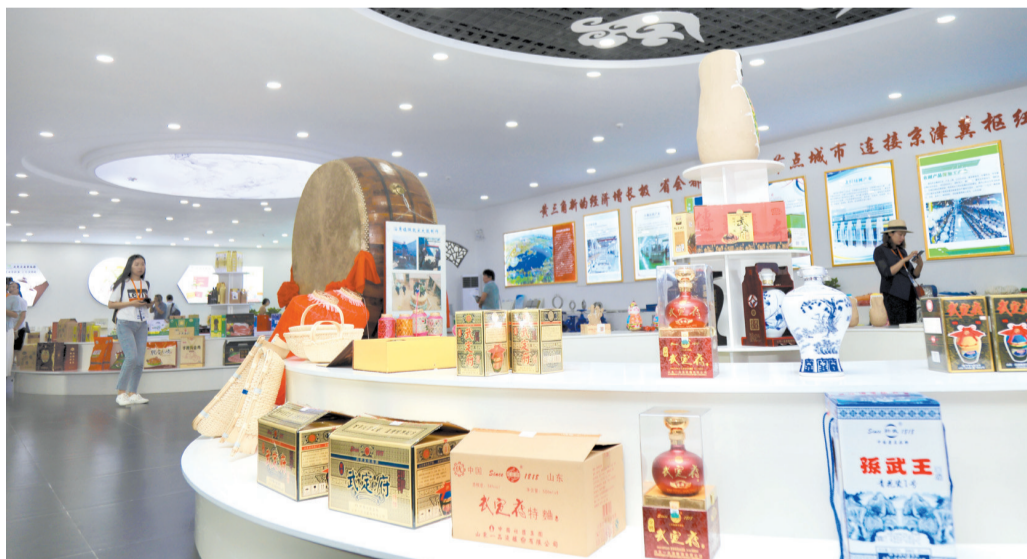
惠民电商服务中心占地20余亩,电商产业园二楼是惠民特色产品展厅。