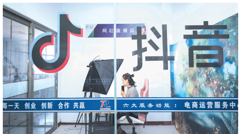
在惠民电商产业园三楼,一家文化传媒公司主播正在抖音平台直播。据了解,这家公司旗下拥有10余位主播。