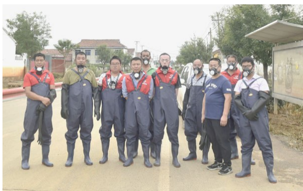
8月16日,高新街道康家村农民志愿救援队在小刘村帮助防疫后合影。