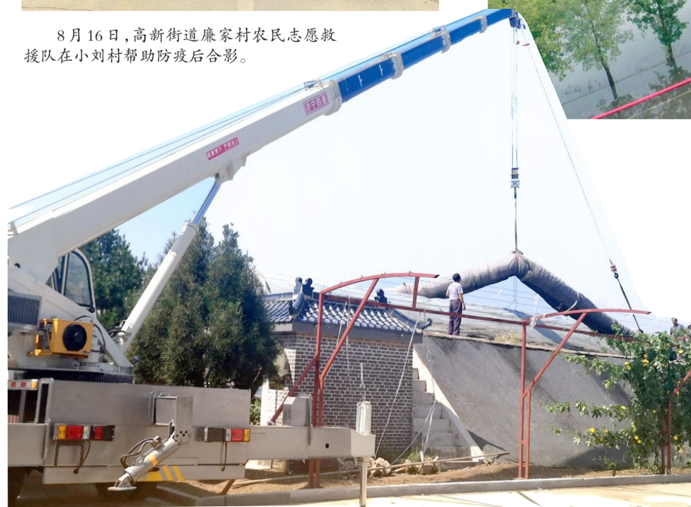
8月15日,明集镇农民移走蔬菜大棚的盖被,晾晒大棚,准备生产。