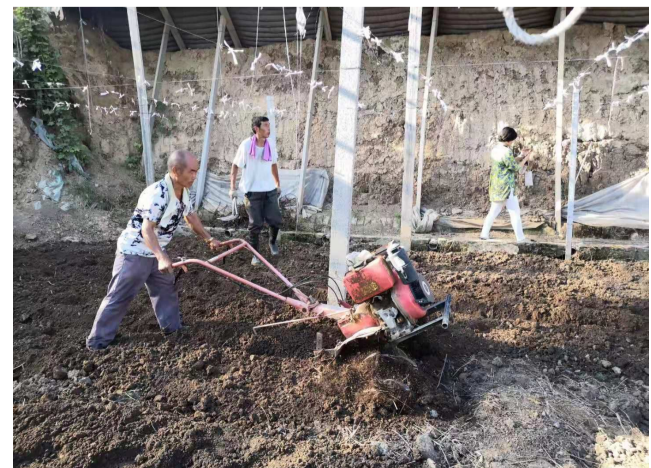
8月30日,明集镇茂圣生态农业科技公司,工人正在翻土准备种6个大棚的草莓。