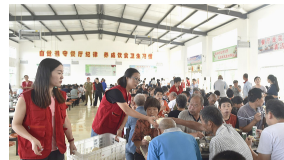
8月14日,高新街道志愿者在高新小学安置点为村民分发食品。