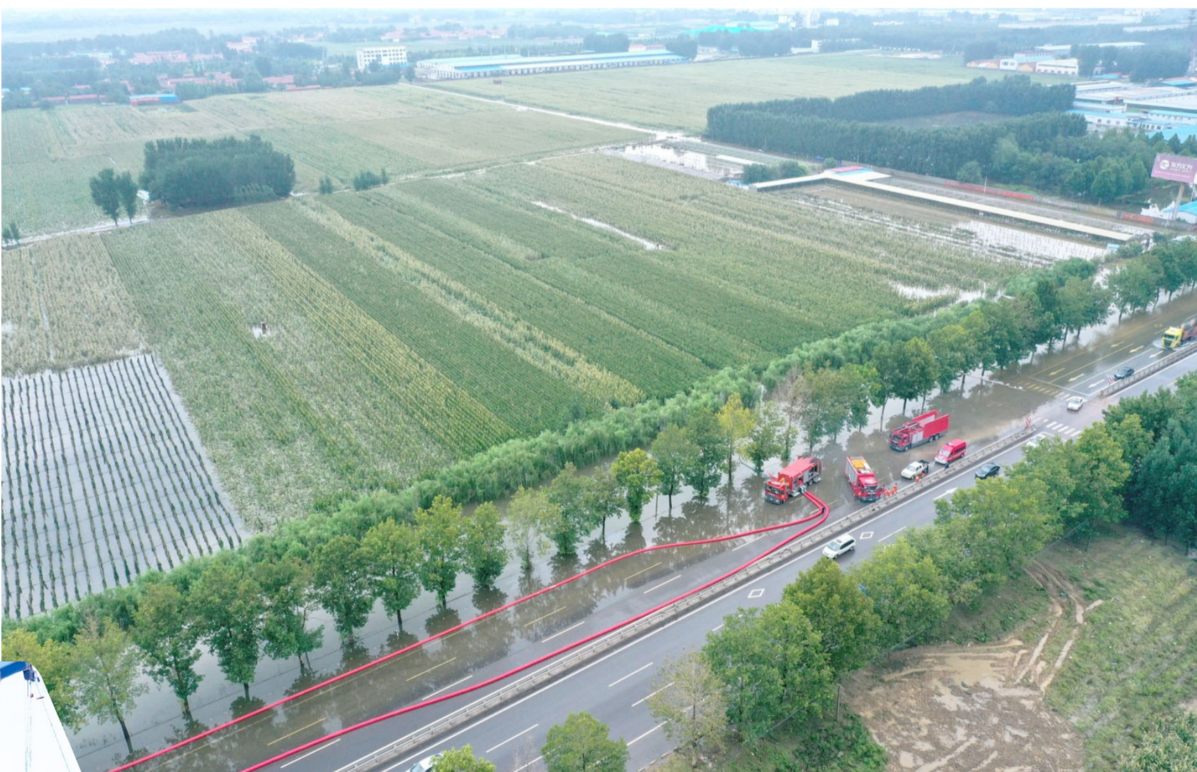
8月16日,外地消防救援队在高新街道西神坛村农场进行农田远程排水。