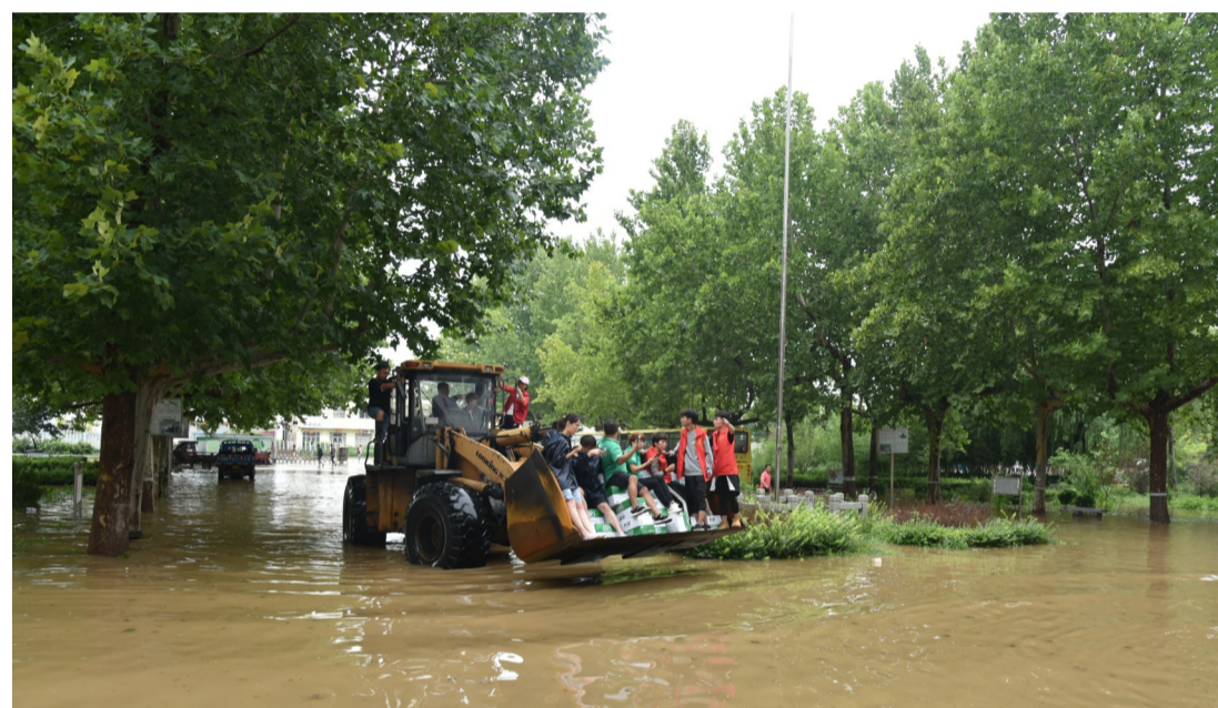
8月13日,党员干部和爱心志愿者到长山镇受灾村庄进行救援。