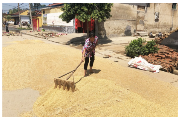
8月15日,长山镇毛张村村民在家晾晒被洪水浸泡的粮食。