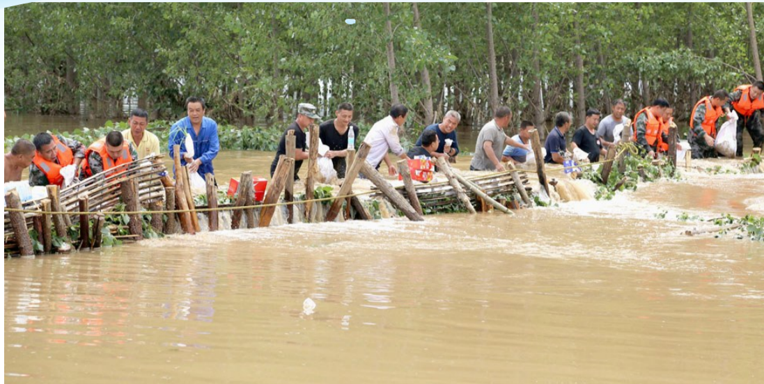
8月14日,邹平市民兵和焦桥镇干部群众在围堵胜利河河水,以减少对周边农田的影响。