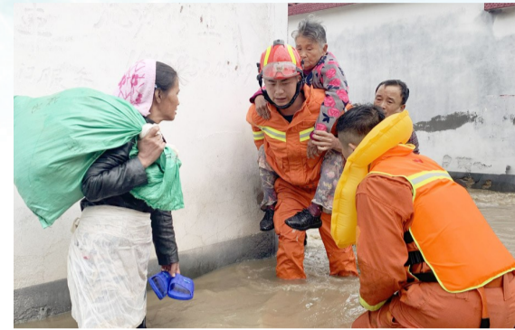
8月13日,邹平市消防救援大队队员在长山镇甘中村将一70多岁的老太太及其家人救出,并转移到安全地带。