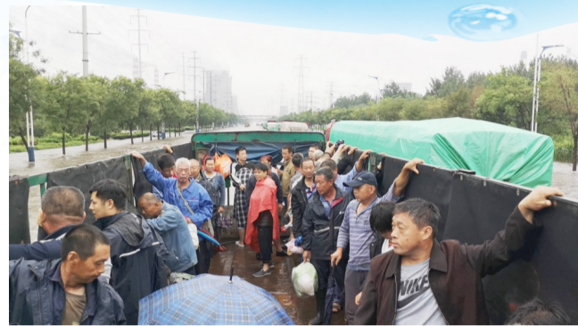
8月12日,高新街道用大卡车转移房家桥村村民到安置点。