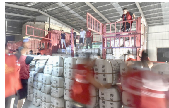
8月14日凌晨,志愿者们顾不上休息,卸载来自济南、滨州的救灾物资。

今天,我们选取抗洪、重建中的部分镜头,记录那些温暖、震撼人心的片段、瞬间,铭记这段历史,诠释“抗洪精神”,凝聚力量,激励大家阔步前行。