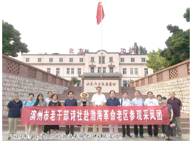
2019年7月份组织的渤海革命老区采风活动。