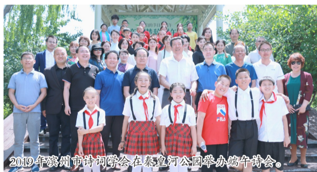
2019年滨州市诗词学会在秦皇河公园举办端午诗会。

如何通过互联网推动诗词及传统文化在滨州进一步传承发展?对此,滨州网及滨州市诗词学会将携手共进,积极借鉴外地先进经验,不断探索创新出滨州人的新路子。