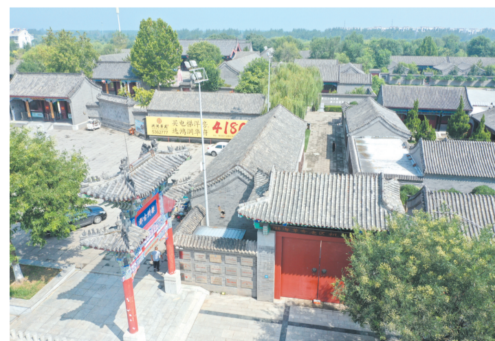
武定府衙及渤海革命老区机关旧址