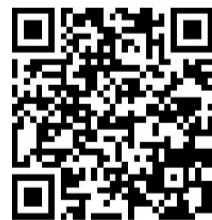
扫码看更多精彩内容

新政务服务中心建成启用,优化行政许可事项214项,精简审批环节295个,压缩办理时限1621天。乡村振兴战略高质量实施,美丽乡村建设投入4000多万元,建成示范片9个。医改工作走在全国前列,10件民生实事顺利实施。