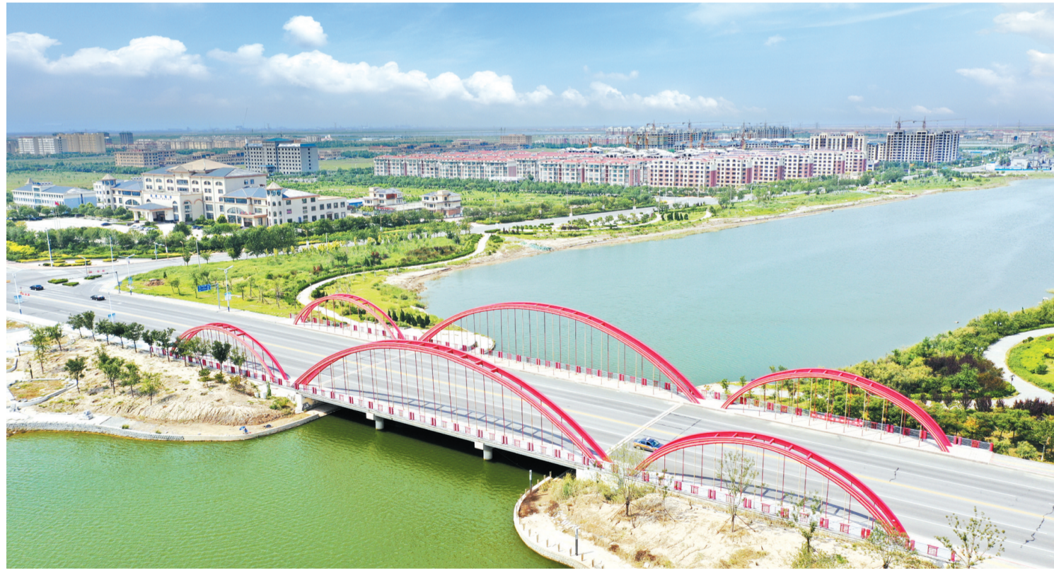
北海黄河古道彩虹桥