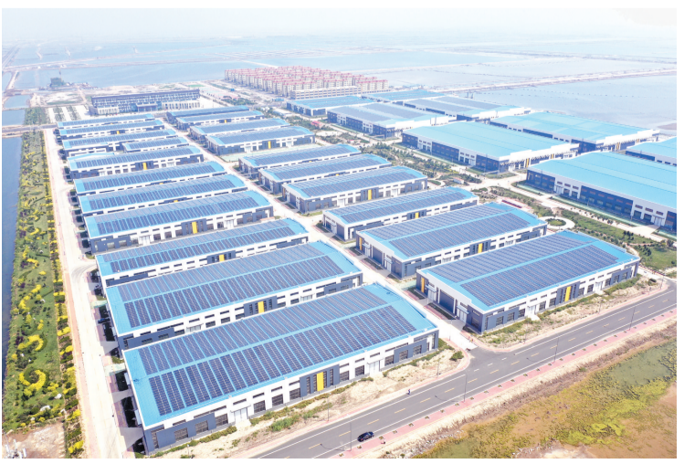
北海科技孵化器园区