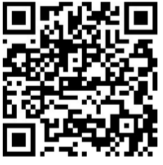
扫码看更多精彩内容

全力打造战略性新兴产业融合发展临港经济集聚区。重点培育建设港口铁路物流园、液体化工物流园及高端化工物流园,努力培育和引进一批现代物流企业。加快推进海港港区重点项目建设,打造集物流仓储、高端化工、高端装备制造于一体的临港经济产业园。