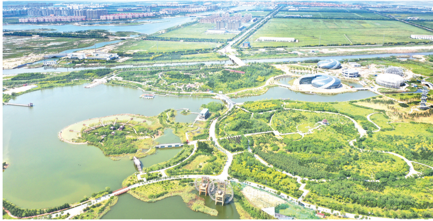
北海风鸣湿地公园