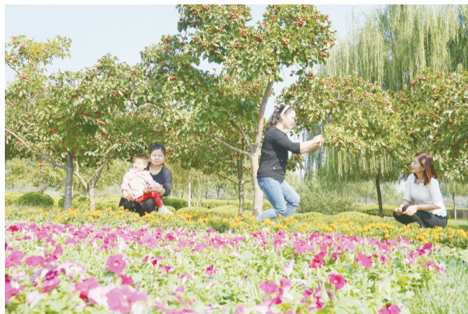
市民驻足观赏百花争艳的花田。