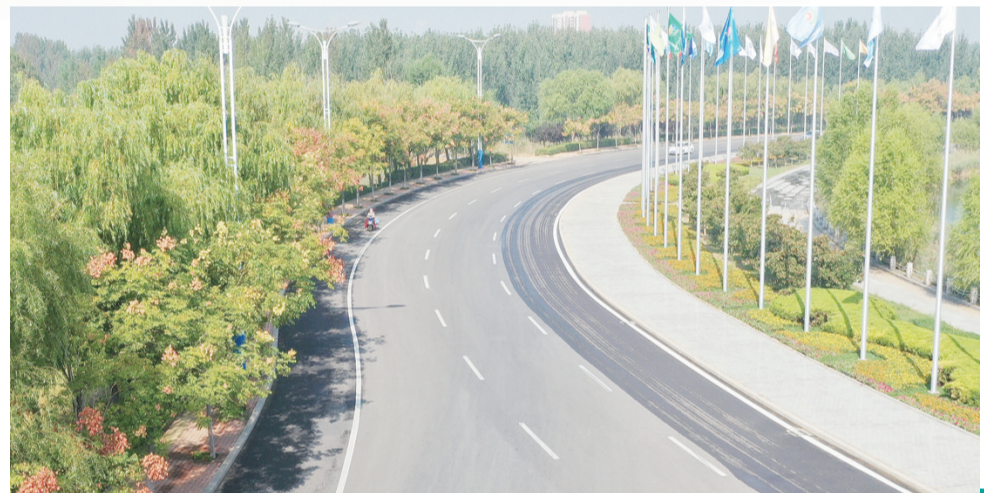
优秀企业旗帜广场上飘扬的旗帜都是滨州的亮丽名片。

滨州日报/滨州网讯(记者 田军 通讯员 王梅 报道)为庆祝新中国成立70周年,进一步绿化美化城市形象,滨州经济技术开发区在辖区重要路段、节点和桥梁两侧栽摆鲜花,安装国旗、国庆道旗。