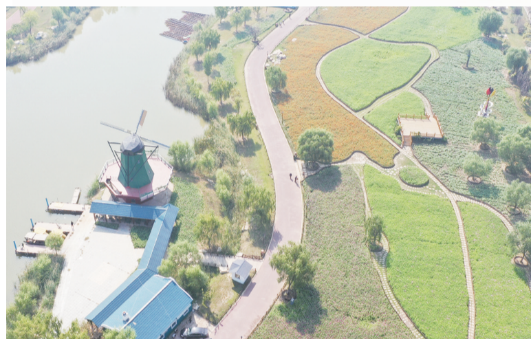
波斯菊、硫华菊、百日草等花卉争奇斗艳。