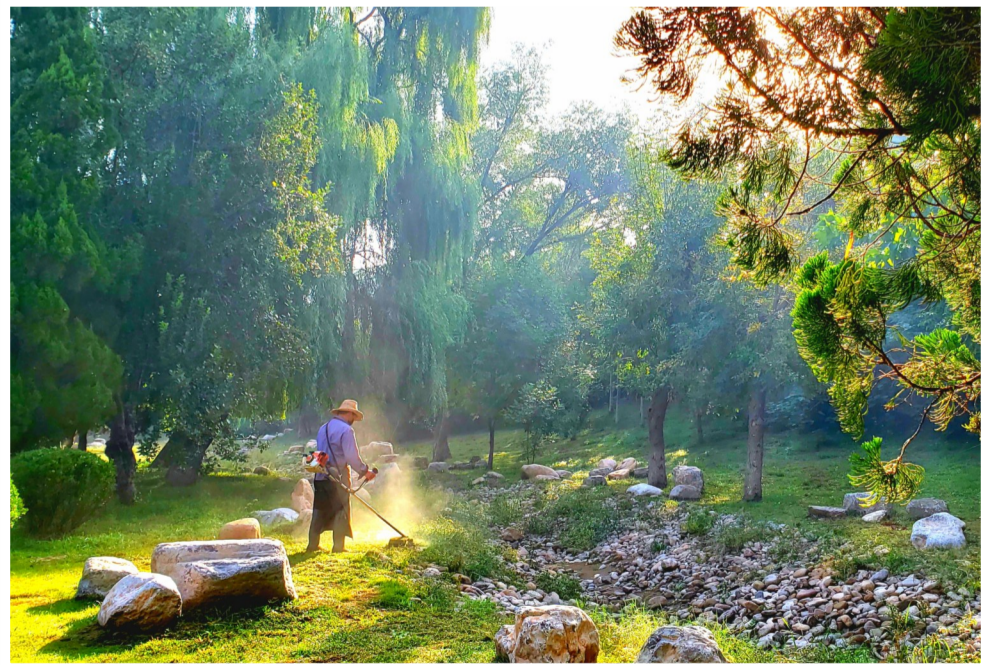
森林美容师