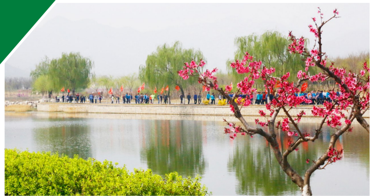
阔步在美丽的春光里