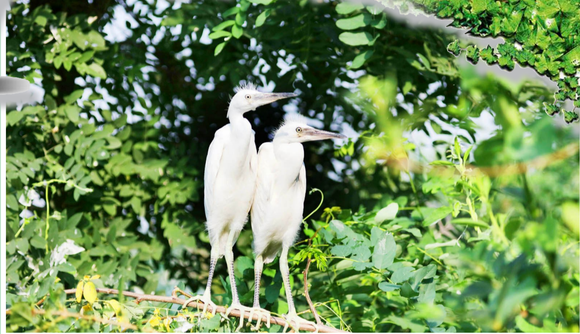
《湿地鸣奏曲》

今日起,本报推出“滨州绿色生态文明实践”系列专版,对全市国土绿化工作形成的经验、特色和成效进行全面报道,进一步深化全民对造林绿化的共识,凝聚协作的力量,持续推进滨州林业工作发展,不断提升生态文明建设质量效益。