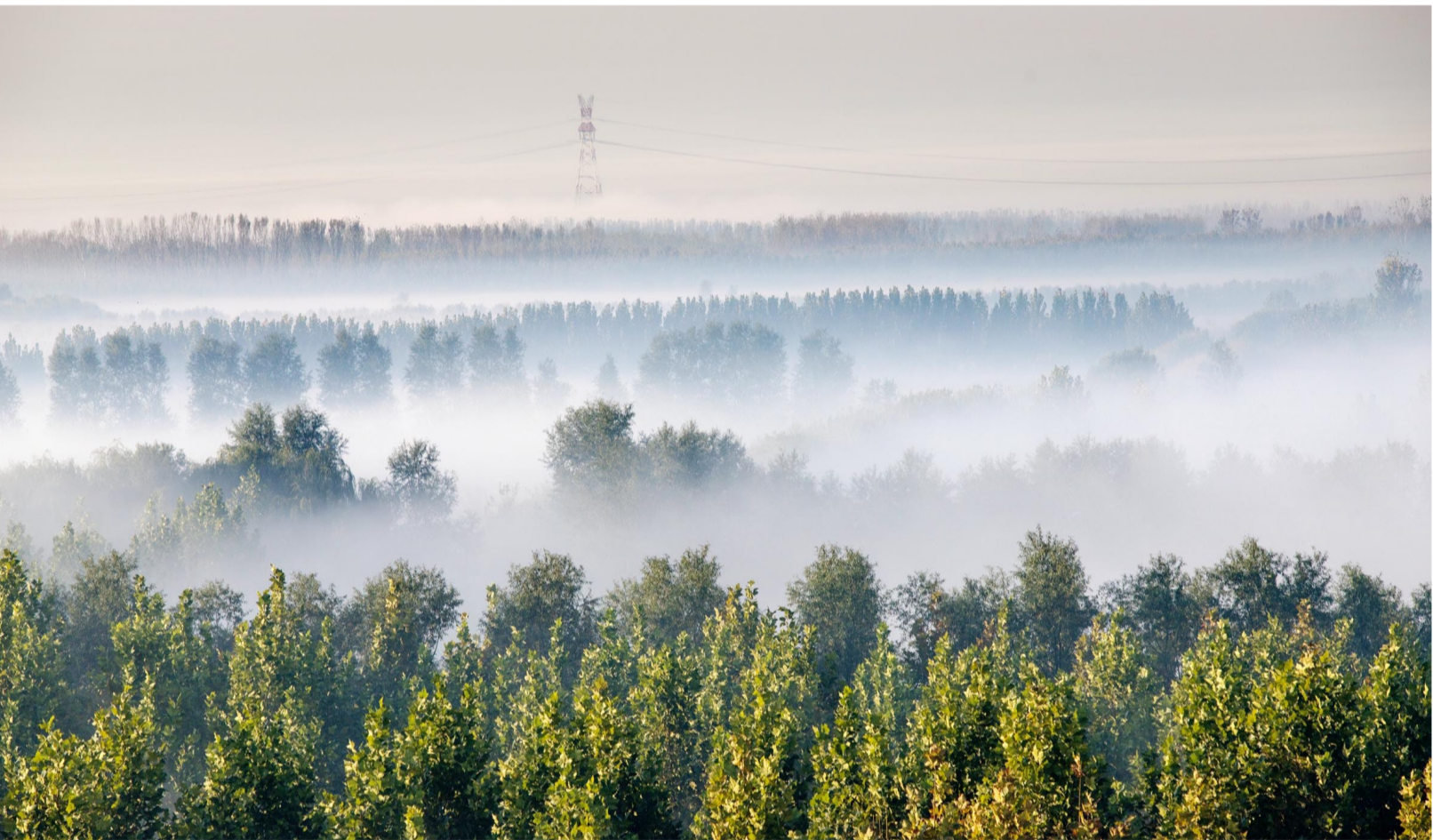
《森林氧吧清新滨州》