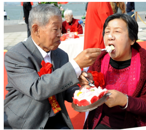
来口醇香的蛋糕,品甜蜜生活味道。