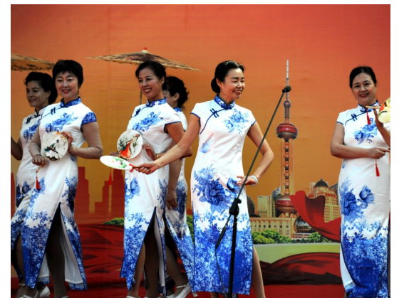
现场上演精彩的旗袍秀表演。