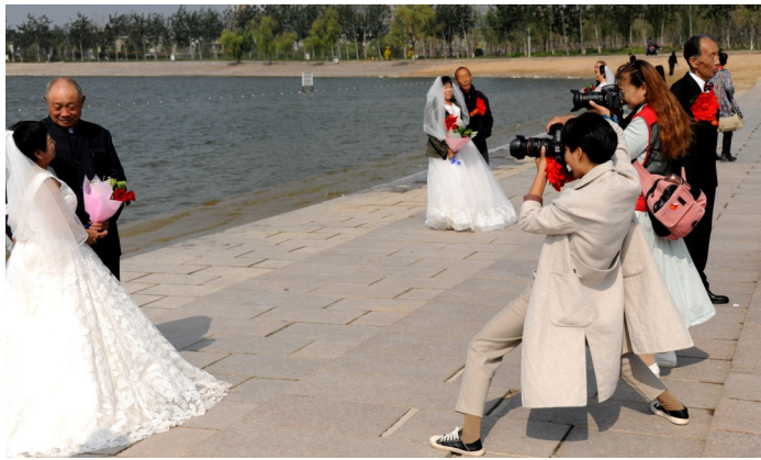
老人们换上婚纱礼服,在中海畔合影留念。