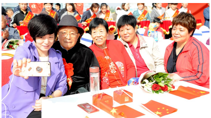
镜头记录下这温情时刻。