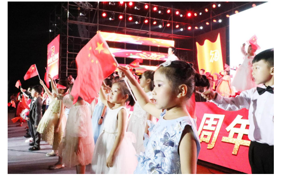
千人合唱《歌唱祖国》