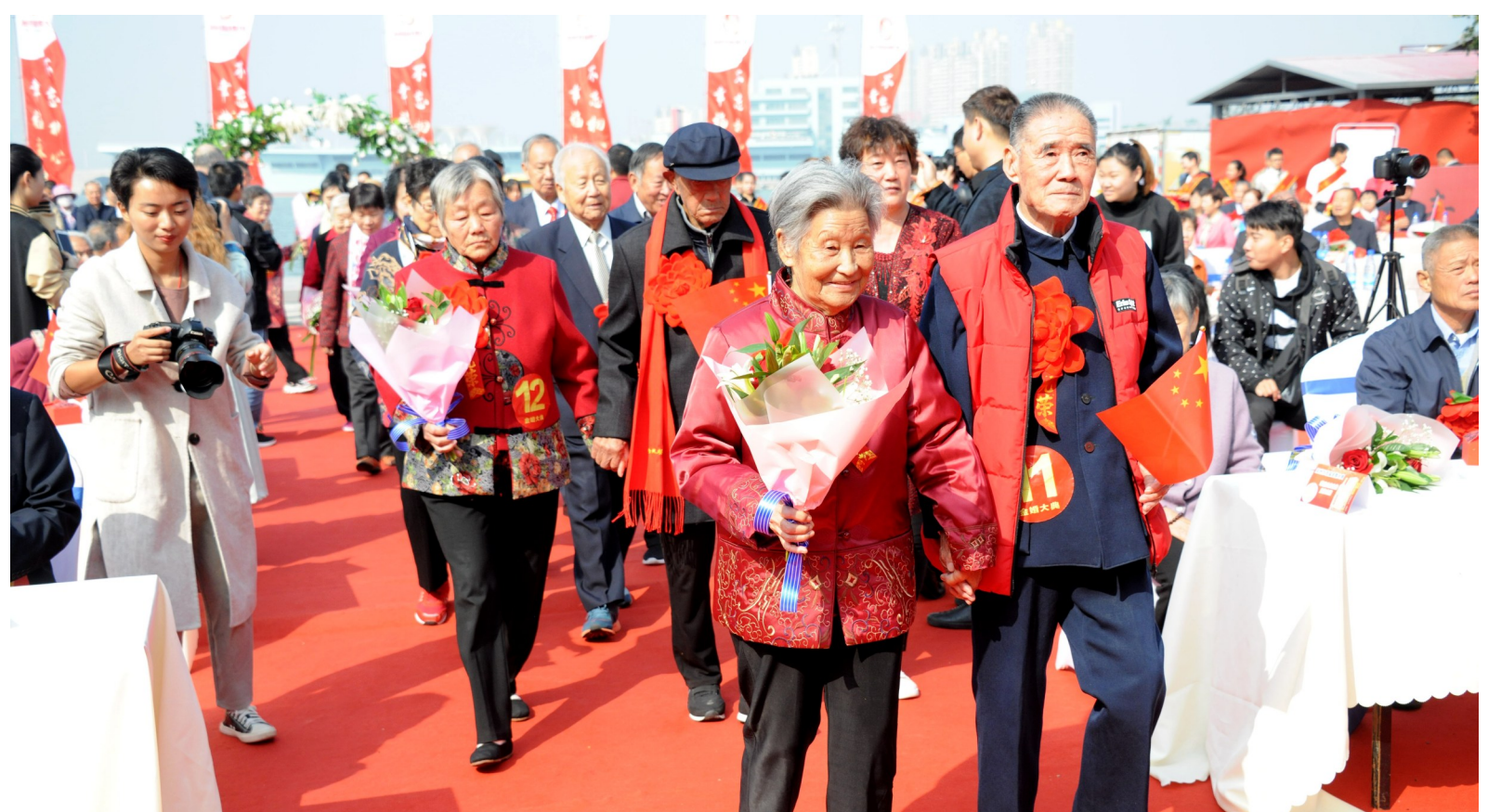
老人们携手走上红毯,诠释“执子之手、与子偕老”真谛。