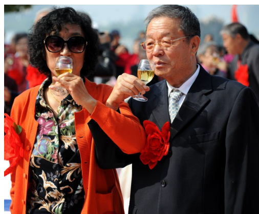
同饮交杯酒,共度金婚日。

此次活动不仅弘扬了中华民族尊老、爱老、敬老、孝老的传统美德,更让老人们在中国共产党成立70周年之际再次回味了自己浪漫的过往,同时也给了年轻人教育、引领和启迪。