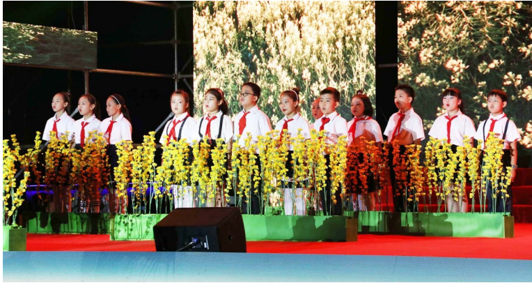
独唱《在灿烂阳光下》