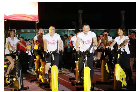
歌伴舞《赞赞新时代》