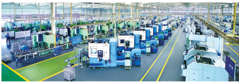
世界单厂生产能力最大的活塞制造企业——渤海活塞。

验研发综合楼、车间及生产线等,年底投产,生产规模达17000L超高精度光刻胶,年产值1.38亿元。北京凌天集团智能机器人产业基地项目,投资1.5亿元,入驻7000平方米闲置厂房,年底投产,年产智能机器人3000台,产值3亿元。航桥新材料汽车、航空航天用高性能铝合金锻件深加工项目,投资3亿元,年产汽车零部件200万件、军用铝合金锻件500吨,计划2022年3月投产,年产值5.1亿元,利税2000万元,新增就业120人。滨州经济技术开发区将以此次集中开工仪式为契机,围绕项目抓招商,设立