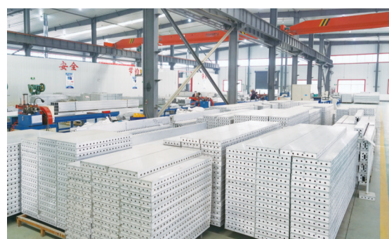
泰义金属铝板系统的研发生产为铝材深加工趟出了一条新路子。