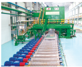
汽车铝板生产项目。