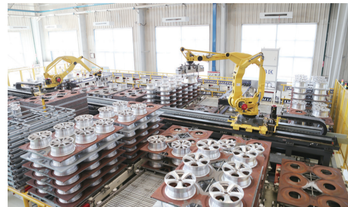
盟威戴卡实施智能发展和绿色发展,打造高端铝制平台,轻量化、智能化水平世界领先。

1亿元引导资金,参股省新旧动能转换基金1.5亿元,全力支持入区项目建设。设立优化营商环境监督电话和邮箱,安排专人负责,对企业反映的诉求做到有问必答、有求必应,打造“阳光、高效、安全、诚信”的政府服务品牌。实施人才集聚工程,对企业一线千人计划专家、泰山产业领军人才、全日制博士、首席技师等高层次人才分别给予一次性生活补助。实施教育留智工程,实现从幼儿园到高中“一站式”全程优质教育,打造高级人才云集、创新要素富集、创业氛围浓厚的高端人才聚集区。