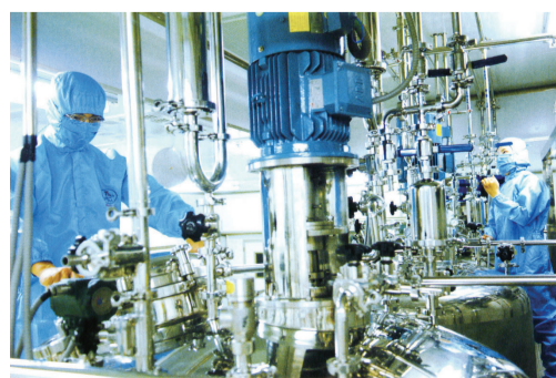
绿都生物高科技园国家兽药GMP生产车间。