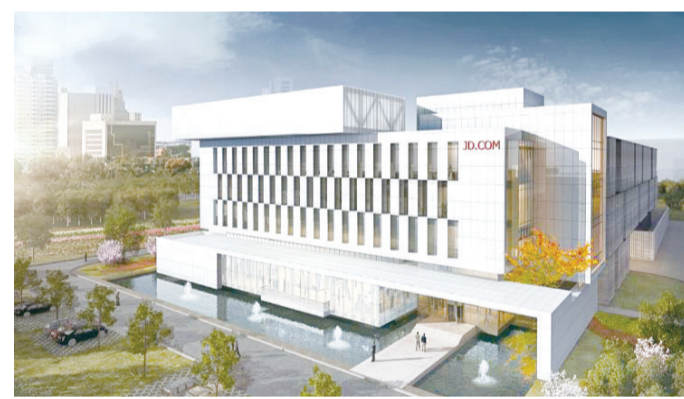
滨州·京东黄河三角洲大数据中心(效果图)

在加快建设,届时,滨州到北京的时间可缩短至1小时左右,成为连接东北、华东、对接京津冀和长三角的重要通道节点。明珠广场、滨州汽车总站、黄河三角洲文化产业园、国际会展中心等工程成为城市新地标。立足搭建起了良好的载体和平台。三个高速路出口及滨州汽车总站坐落辖区,1小时可到5万吨级滨州港,1小时可达济南国际机场,2小时可至天津,3小时可抵青岛港,3.5小时即达北京,滨博高速、滨大高速、荣乌高速、黄大铁路、滨港铁路、德龙烟铁路、220国道、滨州大高航空城纵横交错,编织起四通八达的陆海空交通网。高速城际铁路——环渤海高铁和国家“十三五”重点建设项目——京沪高铁二线正