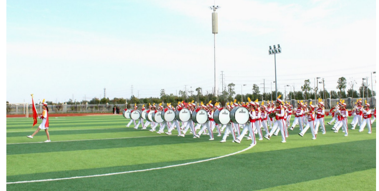
10月12日,在阳信县少先队鼓号队交流展示活动中,以留守儿童为主要队员的温店镇蔡王小学鼓号队脱颖而出,荣获“金号奖”。比赛中,蔡王小学鼓号队队员在铿锵有力的鼓乐中,依次变换出展翅的雏鹰、旭日东升和祖国万岁等队形,展现了少年队员们的蓬勃朝气。