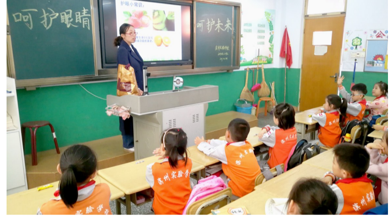
10月14日,滨州实验学校小学部2018级12班举行“呵护眼睛·呵护未来”主题班会,旨在引导孩子们自觉爱眼护眼。活动中,来自滨医附院的眼科专家作了《用眼护眼健康保健知识》讲座,从学习、饮食、卫生、游戏等方面讲解了护眼小知识,提高了孩子们的爱眼、护眼意识。