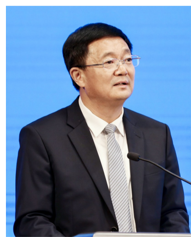
发展的各位嘉宾朋友表示衷心的感谢！习近平总书记提出，山东省要

尊敬的国际铝业协会秘书长耐普先生，尊敬的各位嘉宾，女士们、先生们，朋友们：大家下午好！世界选择中国，机遇眷顾滨州。今天，有幸与多年来精诚合作滨州，信任支持滨州、关心厚爱滨州的嘉宾朋友，相聚在首届跨国公司领导人青岛峰会，必将是一段激情澎湃的美丽约会。同时，以城市路演人的身份，参与我在商务厅工作时申报筹备的青岛峰会，又有一种岁月不居、时节如流，疾行莫待闲的人生感慨。“良伴同行路不遥”。正因有大家与滨州同行，我们的每一段旅程都踏实、每一寸光阴都温暖、每一点激情都源于内心的释放！在此，向各位嘉宾朋友表示热烈的欢迎！向关心支持滨州