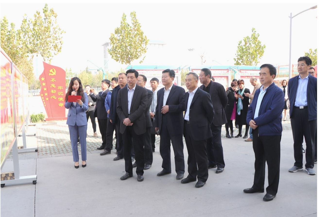
听取沾化区总工会2019年度重点工作情况介绍。

“智慧工会”建设有了新进展，APP上线率有了新提高。截至10月29日，工会组织数2170，工会组织采集率67.52%；实名采集会员数344904，实名会员采集率75.57%。