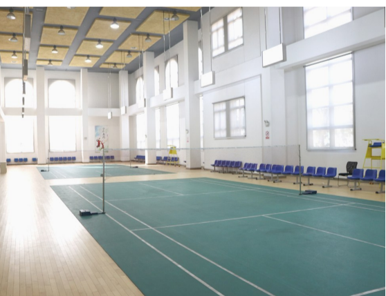
沾化区工人文化宫羽毛球馆。