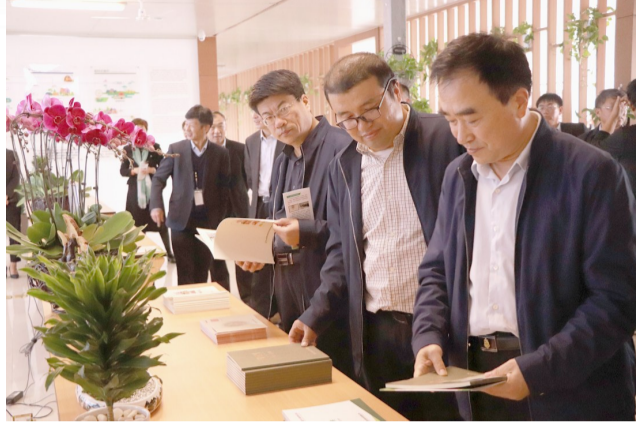
观摩博华农业有限公司省级“工友创业园”。