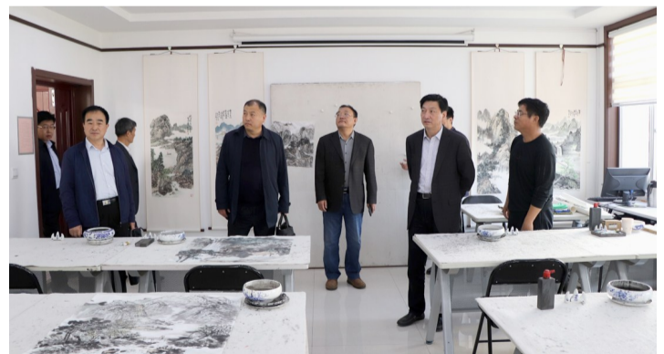
博兴县工人文化宫国画培训教室。