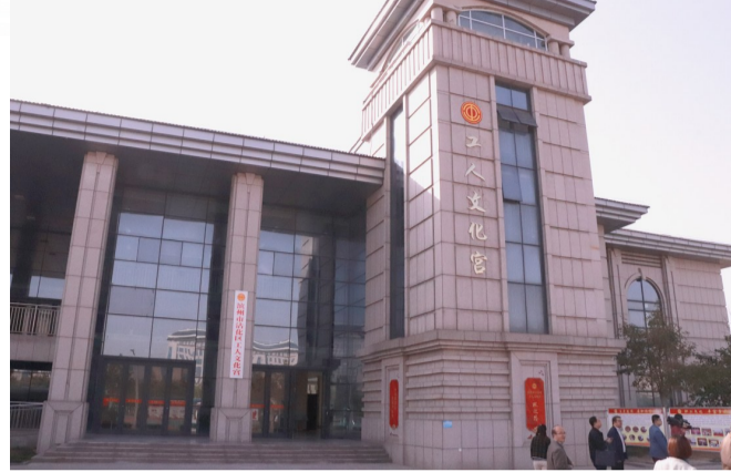
沾化区工人文化宫外景。