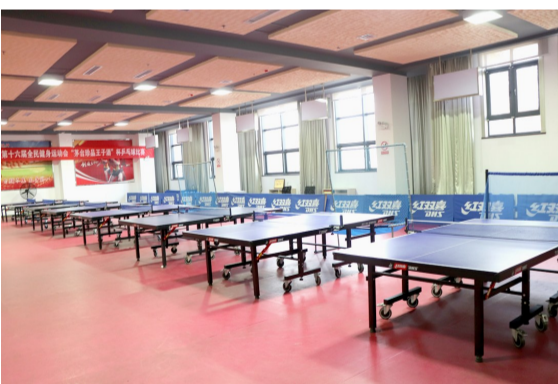
沾化区工人文化宫乒乓球馆。