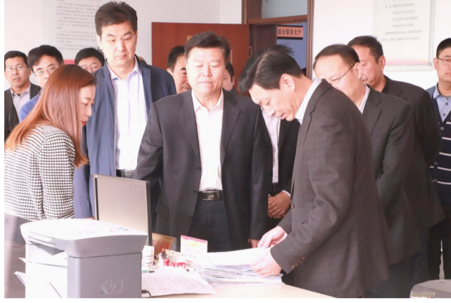
观摩沾化区职工服务中心大厅。

今年以来，全市各级工会组织以开展“不忘初心、牢记使命”主题教育为动力，紧紧围绕省总工会确定的重点工作，结合各自实际，迎难而上、挂图作战，周汇报、月调度，加大力度、加快进度，有的工作已经完成了全年任务，有的工作走在了全省前列，受到了省总的充分肯定。