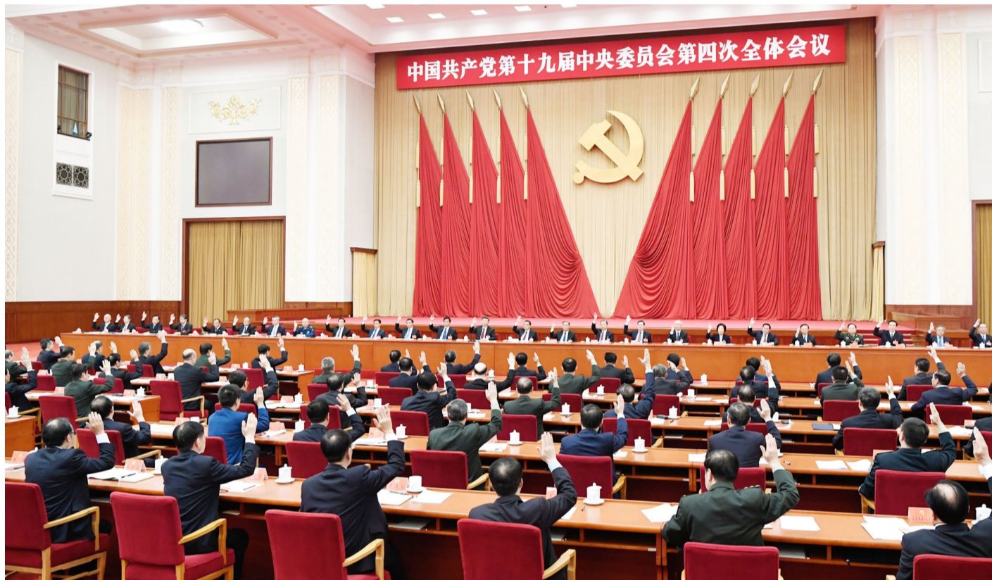
中国共产党第十九届中央委员会第四次全体会议，于2019年10月28日至31日在北京举行。中央政治局主持会议。