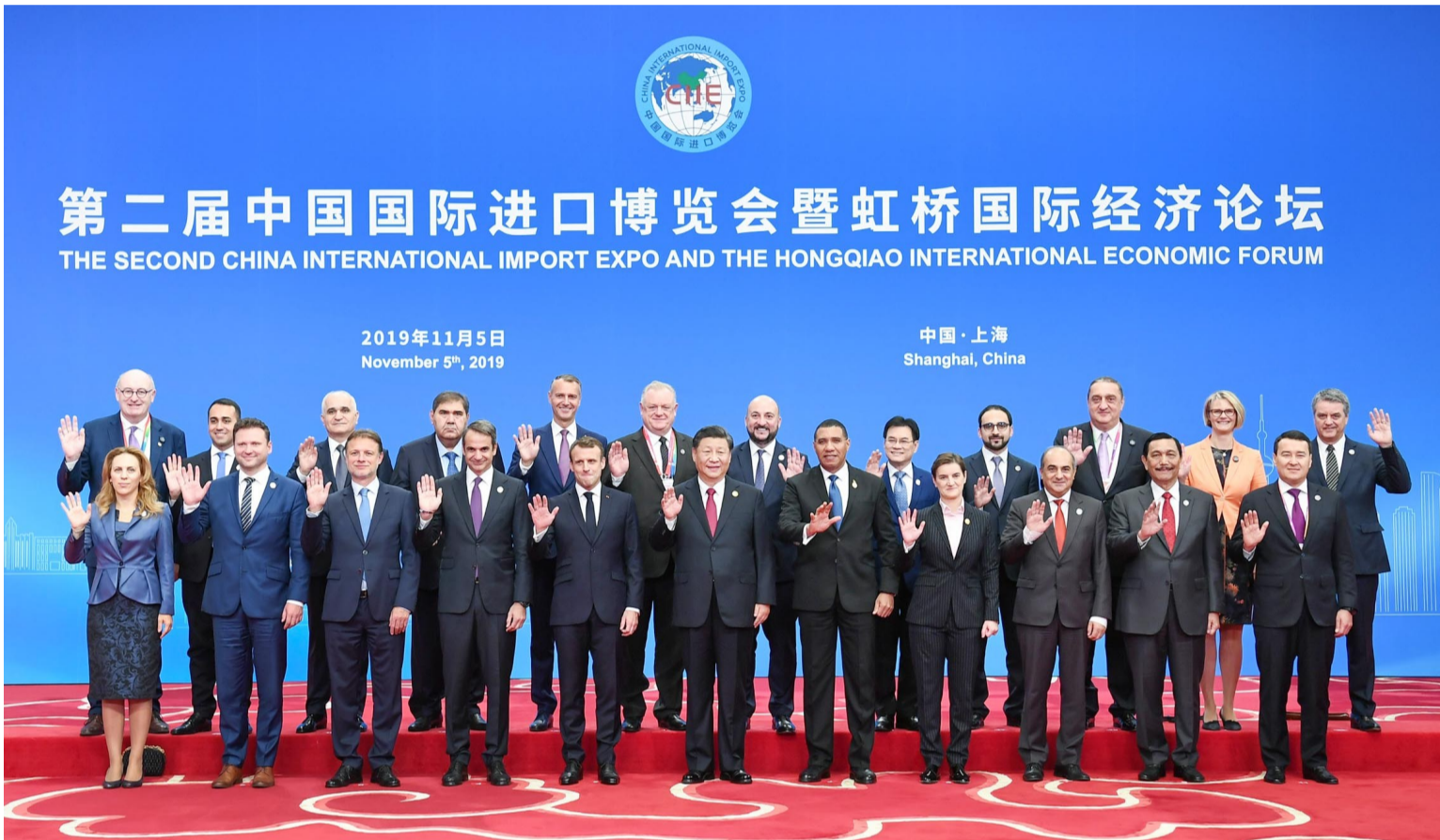
11月5日，第二届中国国际进口博览会在上海国家会展中心开幕。国家主席习近平出席开幕式并发表题为《开放合作 命运与共》的主旨演讲。这是开幕式前，习近平同外方领导人集体合影。

新华社上海11月5日电 第二届中国国际进口博览会5日在上海国家会展中心开幕。国家主席习近平出席开幕式并发表题为《开放合作 命运与共》的主旨演讲，强调各国要以更加开放的心态和举措，共建开放合作、开放创新、开放共享的世界经济，重申中国开放的大门只会越开越大，中国坚持以开放促改革、促发展、促创新，持续推进更高水平的对外开放。