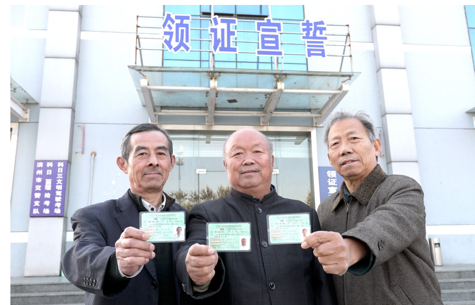
三位老教授如愿领到了驾照。