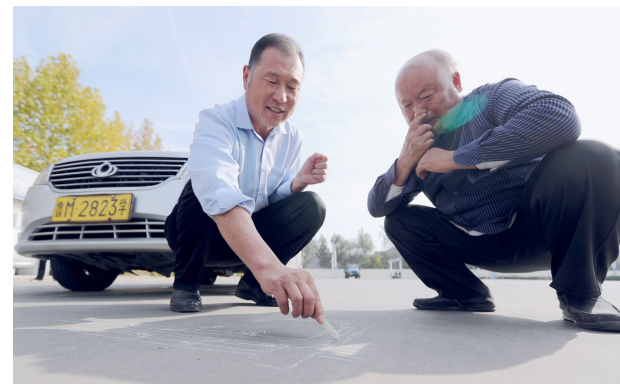
跟教练“绘图作战”,学习驾驶的要领。