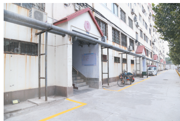
小区楼道口划标志线,规范车辆停放。

着“城市蜘蛛网”问题。小区建成时并没有储藏室,后期建设后无法通电,有不少住户从楼上住楼下储藏室私拉电线,这些外露的“电老虎”不仅有碍观瞻,一旦漏电、短路,很可能发生严重的安全事故。北镇街道联系电业局等相关部门,安排专业施工队伍,在落实“一户一表”的基础上,将楼道全部住户的电线统一捆绑,外封保护管,一同顺到储藏室中。此举既让居民用了电,又消除了安全隐患,露出了清朗的天际线。