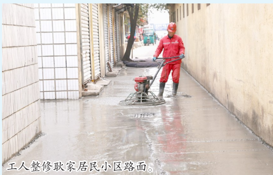
工人整修耿家居民小区路面。

民的“心头病”。北镇街道盘活小区可用空间,腾空菜园用地,铲除荒芜绿植,增加停车位。同时,制作非机动车标志,将标志线划到各个小区楼道口,将居民自行车、电动车的停放点进行统一。北镇街道累计为19个老旧小区增设机动车停车位387个、非机动车停车位157个,停车位全天免费停放。北镇街道协调相关部门,对辖区部分封闭小区安装智能车牌识别系统,提高车位使用率。北镇街道综合执法中队不断