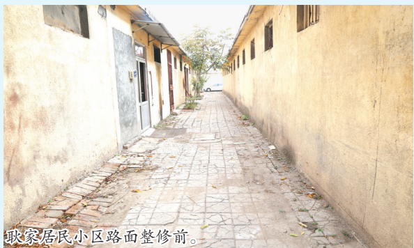
耿家居民小区路面整修前。