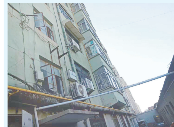
北镇街道石化机械宿舍小区理顺电线后。