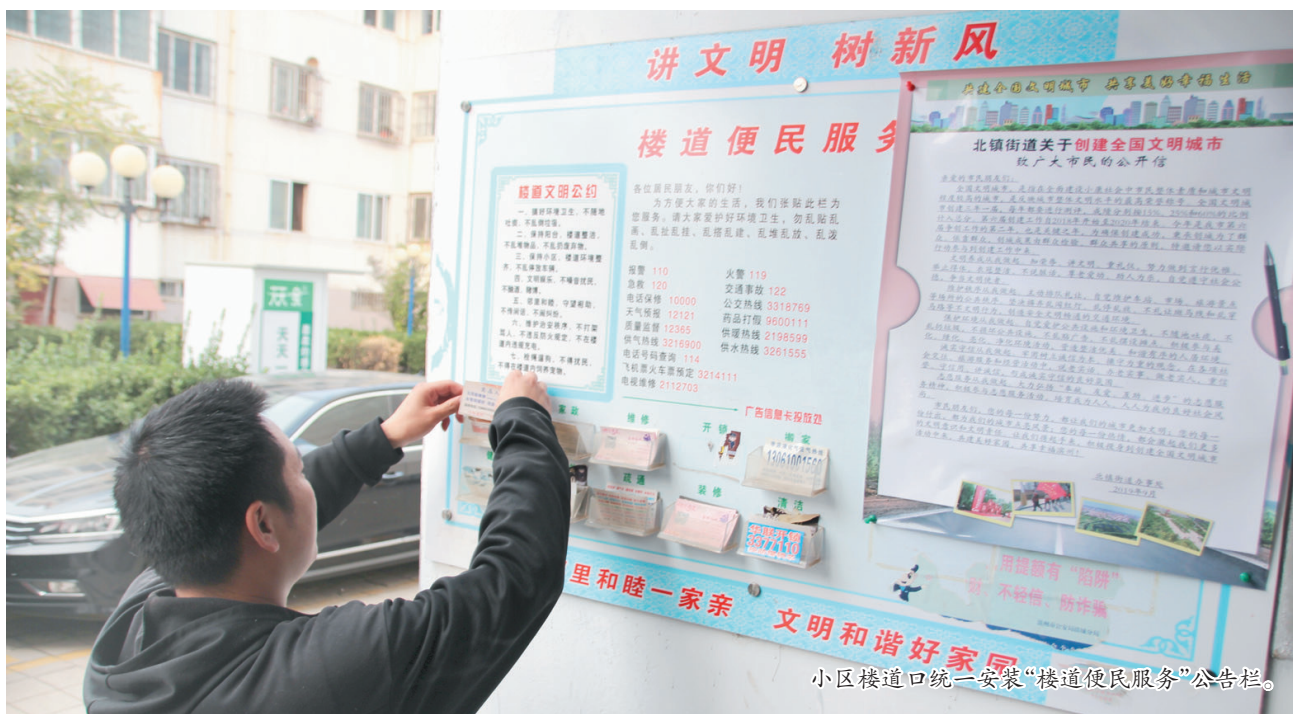
小区楼道口统一安装“楼道便民服务”公告栏。