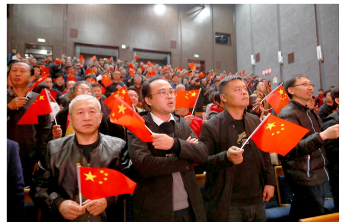
与会嘉宾一同唱响《我和我的祖国》。