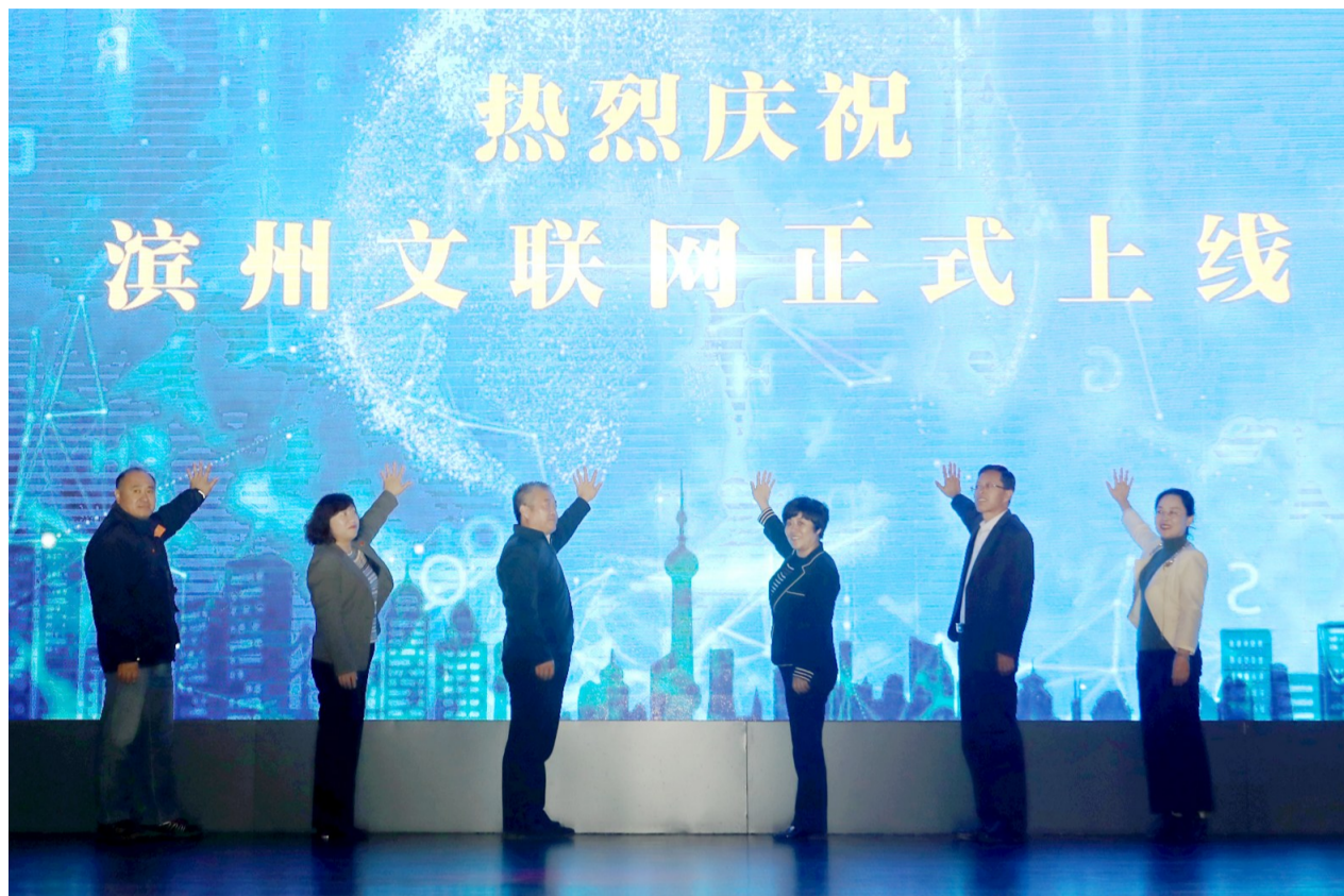
与会领导一起启动“滨州文联网”。

上线仪式后,市文联各协会的艺术家们带来了精彩纷呈的节目。最后,与会嘉宾一起挥舞手中红旗,合唱《我和我的祖国》,将现场气氛推向高潮。