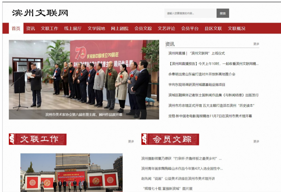
“滨州文联网”主页截图(局部)。