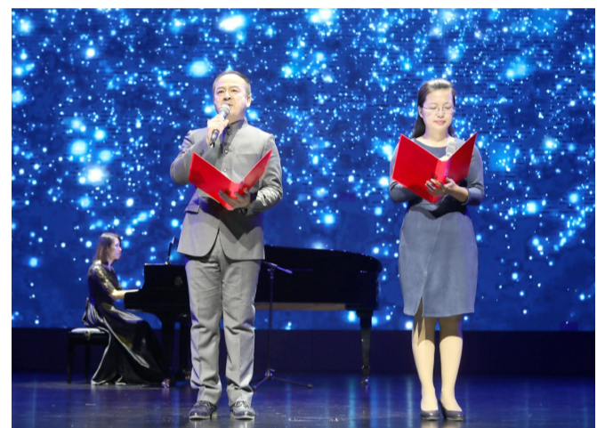
各文艺家协会带着自己的“作品”庆祝滨州文联网上线。