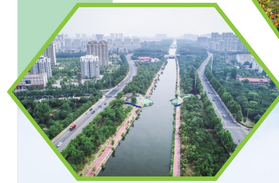
▲新立河两岸美如画