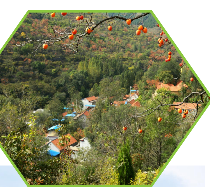
▲山村画卷