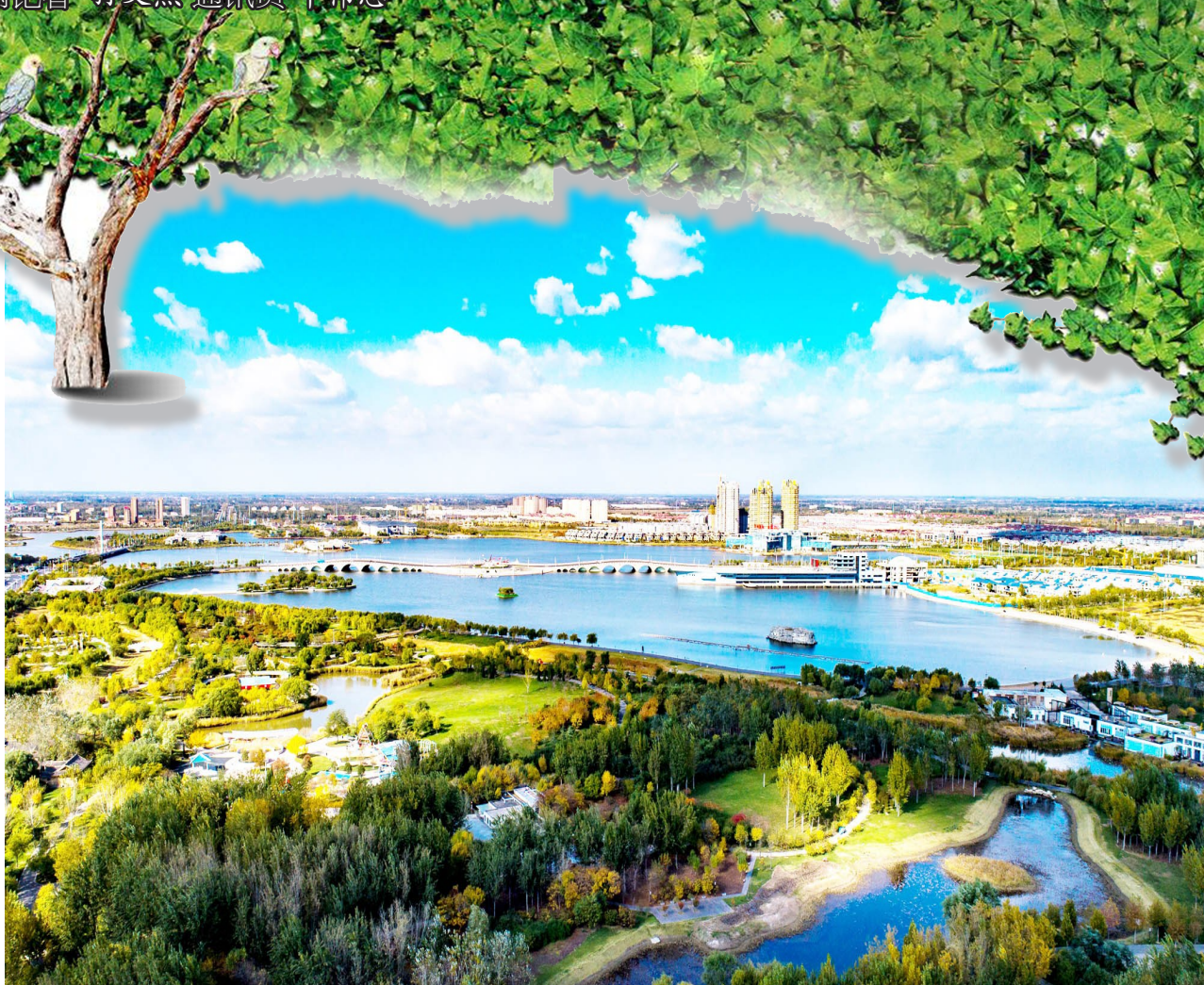
▲中海秋色美如画

滨州严格对湿地的利用监管,强化湿地宣传教育,社会公众湿地保护意识不断提高,保护湿地的社会氛围逐步形成。主要建立了湿地保护修复制度,按照“先补后占、占补平衡”的原则落实湿地面积总量管控,对涉及征占用湿地的所有建设项目依法从严审批,确保湿地面积不减少,湿地资源不退化,全市湿地资源不发生非法占有和流失;在每年“世界湿地日”、“爱鸟周”、“野生动物宣传月”期间,通过多种媒体和丰富的形式,大力宣传湿地的功能效益,湿地保护的重要意义、目标任务和相关要求,动员广大干部群众参与湿地建设管理工作,推动湿地的保护与修复向健康发展。