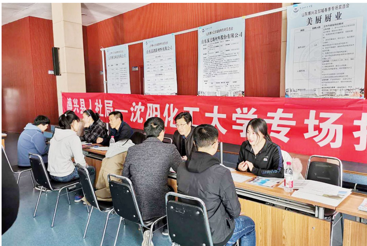
积极组织县域企业外出招聘