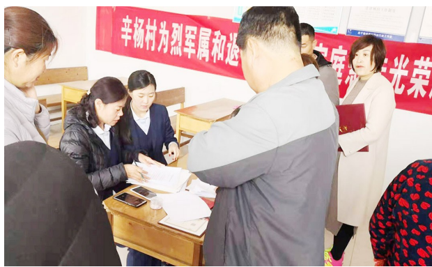
现场签订担保合同

积极帮助毕业生就业创业。在登记报到期间，做好就业创业相关政策宣传，耐心解答毕业生提出的问题。对离校未就业毕业生进行跟踪服务，提供就业指导、就业信息推荐等服务，积极推荐高校毕业生在本县区内各企业就业，协助有创业能力和创业意愿的大学生争取项目、申请创业担保贷款。