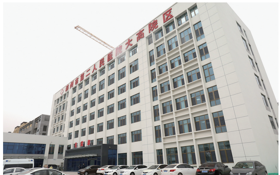
滨州市第二人民医院大高院区于今年7月1日全面运行。

穿越岁月长河,一路披荆斩棘,75载的征程已成历史。面对未来,滨州二院人志存高远,未曾停歇,他们将沿着历史的台阶拾级而上,开启改革创新、创新管理、整体迁建的新征程,朝着建成“安全、有效、无痛、温馨、规范、廉洁”的三级甲等综合医院目标阔步前行,再续医院新一轮大发展的壮美画卷!