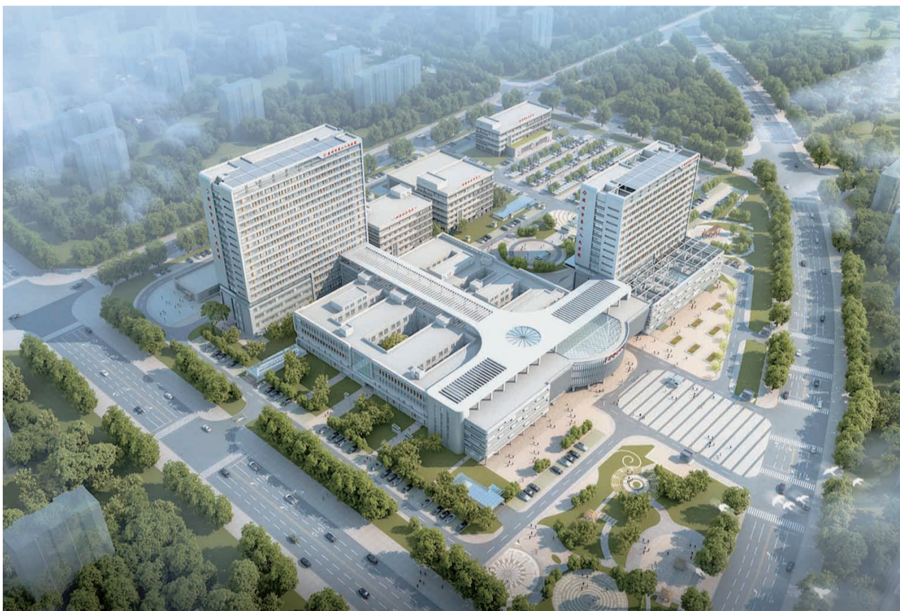
医院新建院区效果图。

堡垒,强化党建引领,着力在抓主抓重上聚力使劲,弘扬医务人员“敬佑生命、救死扶伤、甘于奉献、大爱无疆”的崇高精神,为医院发展提供坚强的政治、思想和组织保证。