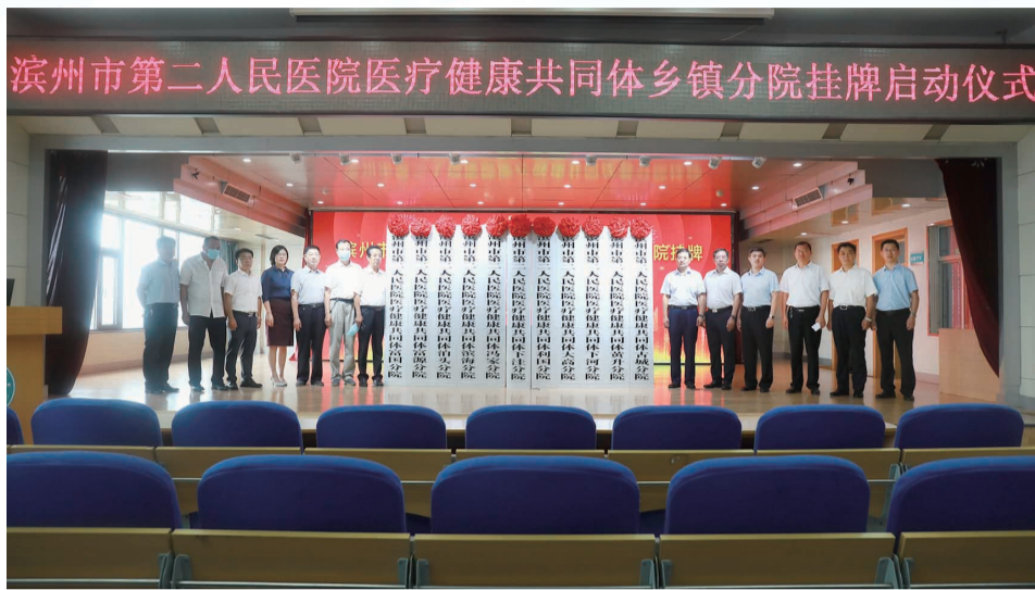
沾化区医共体乡镇分院挂牌仪式。