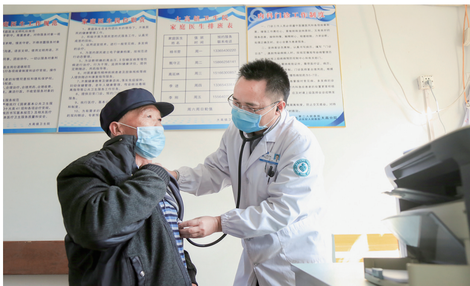
医院长期派专家到各乡镇卫生院坐诊。