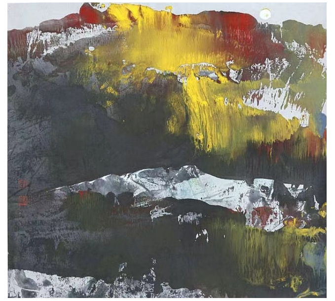
第一代拓彩画——纹理成画。