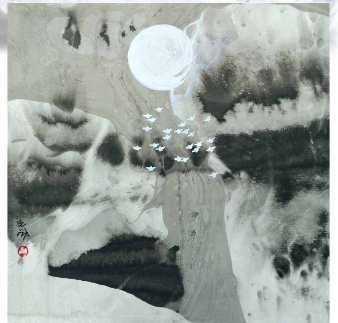
第三代拓彩画——水墨幻境。