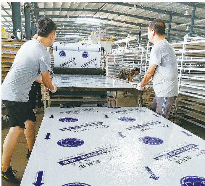
斯蒙特节能技术有限公司生产车间。

滨州日报/滨州网讯(记者 郭刚 通讯员 王德 报道)惠民经济开发区不断加强非公企业党建工作建设,夯实非公企业党建工作基础,把党建活力转化为企业发展动力,把党建优势转化为企业发展优势,以高质量党建引领企业高质量发展。