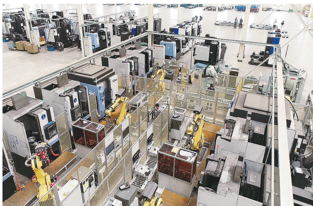
惠宇汽车零部件有限公司生产车间。