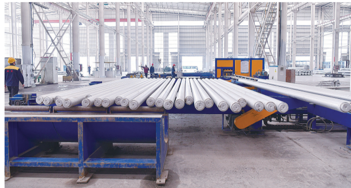
山东创源科技有限公司生产车间。