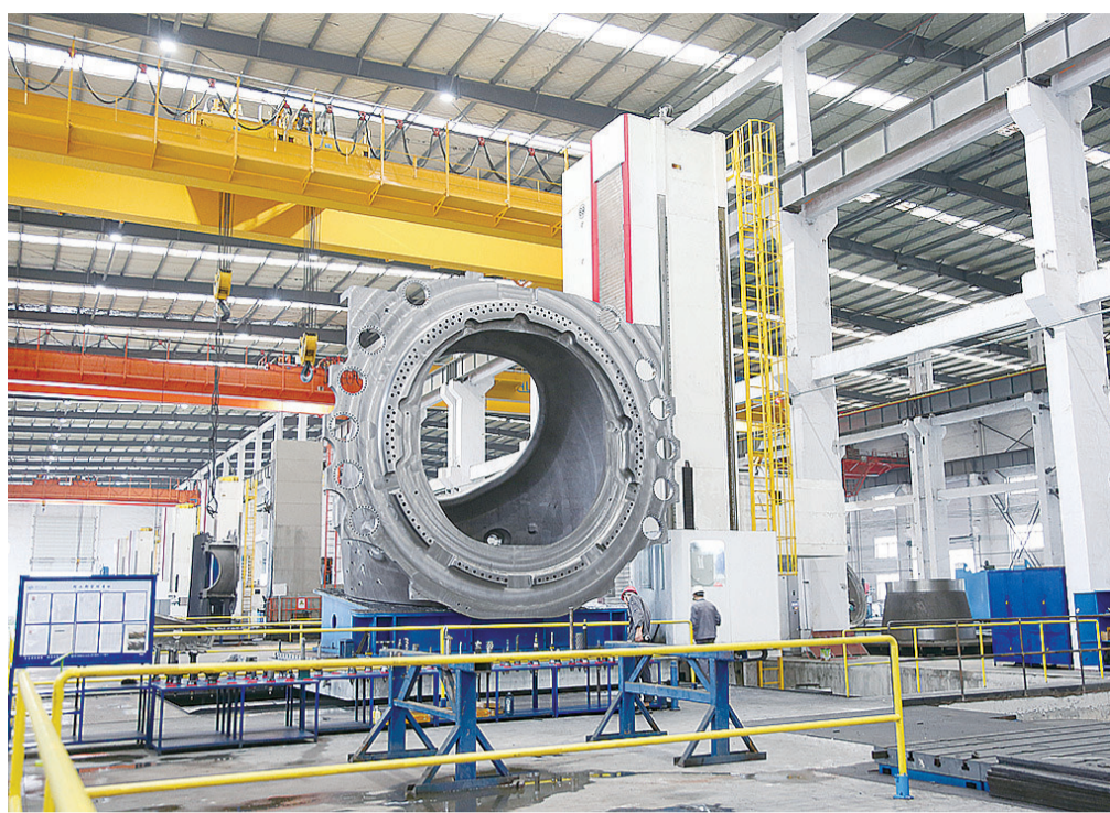
山东国创精密机械有限公司生产车间。

观摩过程中,大家通过听、查、看、谈相结合的方式,由观摩点党支部书记现场讲解非公党建工作思路、措施、亮点和成效;观摩人员实地查阅党建工作各类档案资料;查看阵地建设、制度建设和工作成效等情况;并就观摩有关事项现场互动交流,一起探讨观摩收获和下一步工作改进措施。