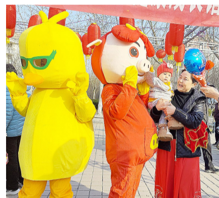
“猪猪侠”前来助阵,与居民热情互动。