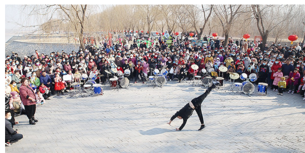
武术表演,引得观众拍手叫好。