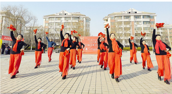
手舞红绸,翩翩起舞。

大红灯笼挂起来,欢快秧歌扭起来……2月3日,滨城区彭李街道黄河社区黄河家园二区广场上欢声笑语、歌舞飞扬,由黄河社区、黄河家园业委会主办的“我们的节日·元宵节”喜乐会热闹闹上演。 上午,在黄河社区服务站,居民们围成一桌,和面、揉面、拌馅……分工协作,配合默契,忙得不亦乐乎;下午,广场上,居民们各展才艺,共叙邻里情谊。黄河