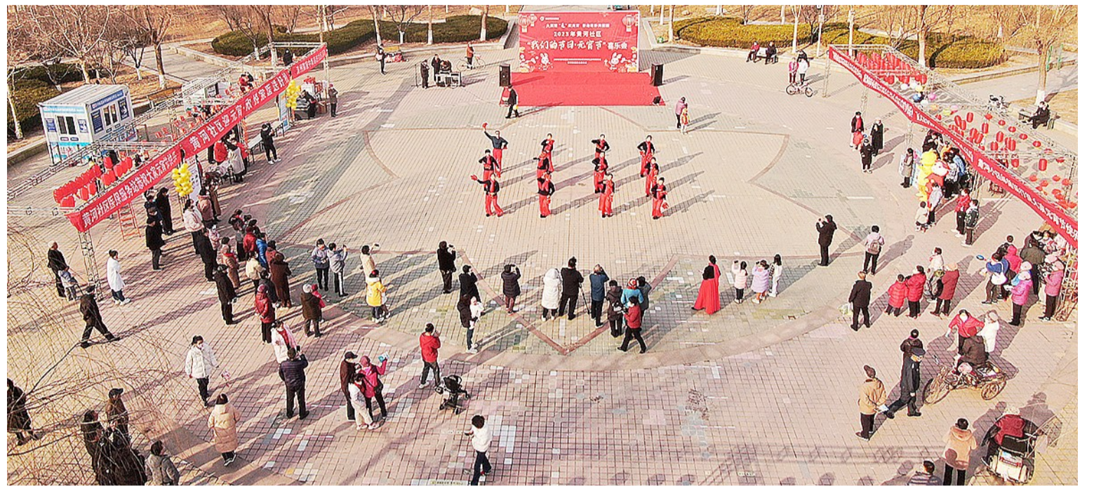
元宵节喜乐会热闹闹上演。

活动持续了一整天。一位居民开心地说:“今年社区组织的活动形式多样、内容丰富,让我们感受到了社区大家庭的温暖和浓重的节日气氛,增进了邻里感情,特别感谢。”