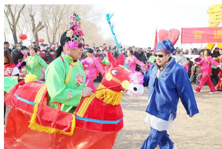
骑小毛驴表演,场面轻松诙谐。