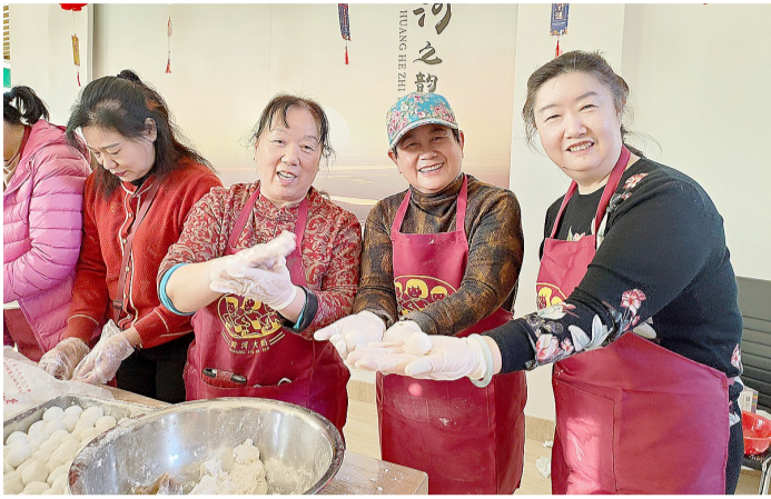
志愿者们聚在一起,制作元宵,畅叙友谊。