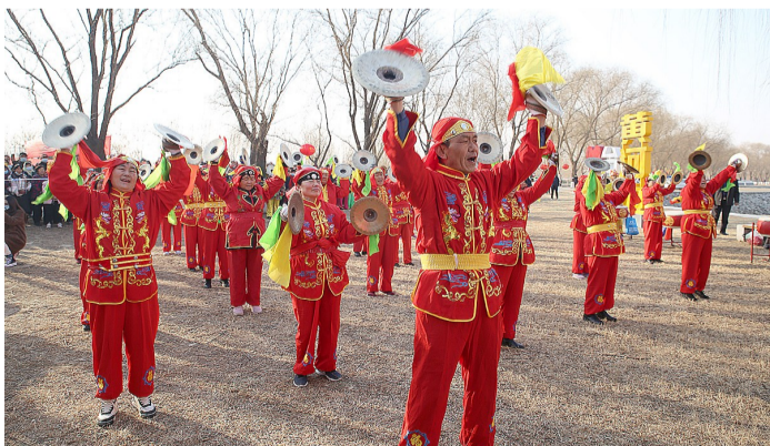
村民们身着喜庆的服饰,动作整齐划一。