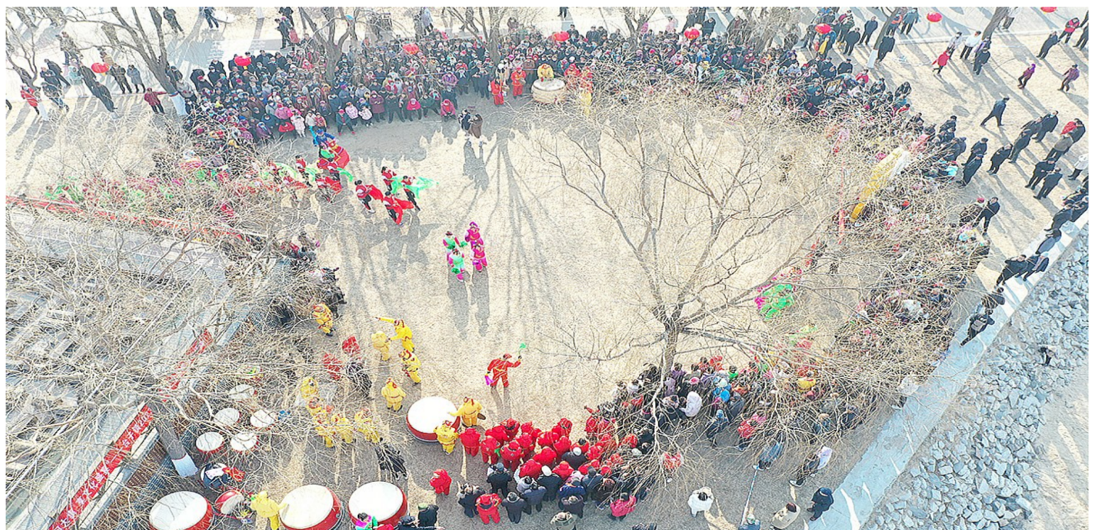
村民们在齐东古城遗址黄河文化园组织开展黄河民俗文化汇演。

跃跃欲试。来自小赵村、店东村、红宋村、店西村、官道村、康家村的秧歌、舞龙、骑小毛驴、划旱船等黄河民俗表演轮番上阵,一次次将活动推向高潮。村民们身着整齐亮丽服饰,以各具特色的表演给现场观众带去别样艺术享受,也进一步