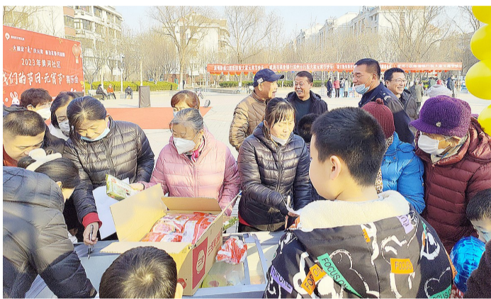
志愿者们分发元宵,共庆团圆。