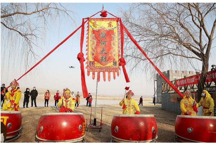
市级非遗——齐东黄河大鼓震撼开场,气势雄壮。