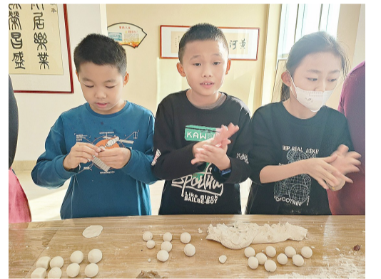
小朋友们学习制作元宵,体验民俗文化。