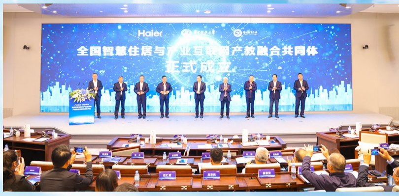
2023年10月24日,海尔集团、华中科技大学、滨州职业学院共同牵头成立全国智慧住居与产业互联网产教融合共同体。