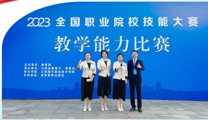
滨州职业学院荣获2023年全国职业院校技能大赛教学能力比赛一等奖。