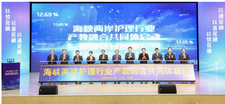
2023年11月26日,第三届海峡两岸(滨州)护理行业产教融合交流大会在滨州职业学院举办。

2023年,滨州职业学院新一届党委团结带领全体师生深入践行立德树人根本任务,广泛凝聚“一家人、一件事、一个目标、一股劲”的团结奋斗精神,关键办学能力和综合办学实力取得突破性进展,学校高质量发展方向更明、思路更清、措施更实、力度更大,坚定不移朝着“冲刺双高三十强、建成职业技术大学”的目标奋力挺进。