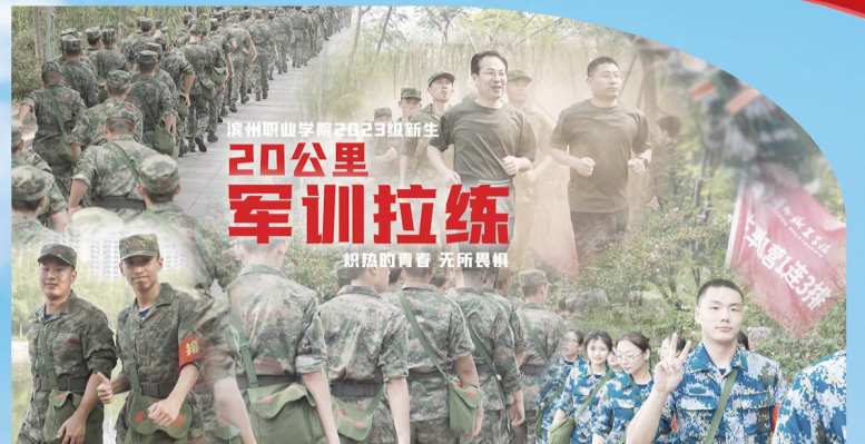
滨州职业学院组织开展首次新生20公里校外徒步拉练活动。