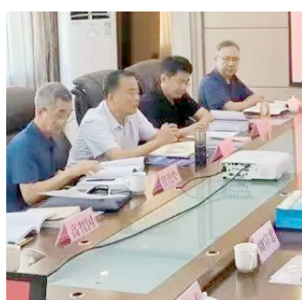
《无棣通史》编纂团队与多方专家座谈交流。

考查利用地方文史和近代馆藏文献、地方志书、社科研究成果等历史资料,广泛吸纳前人和当代文史暨考古专家的研究新成果,用通纪梳理历史脉络,用典志详解地方风貌,用人物传记彰显圣贤功业。历经两年多努力,