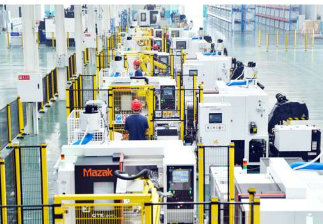
尤洛卡单轨运输系统数字化赋能智能制造项目(高新区)。

习近平总书记强调,要推动数字经济和实体经济融合发展,把握数字化、网络化、智能化方向,推动制造业、服务业、农业等产业数字化。从中不难看出,相较于传统生产力,以数字经济为代表的新质生产力具有引领创新驱动、发展速度快、发展质量高等特点,是以智能技术和绿色技术为代表的新一轮技术革命引致的生产力跃迁。 眼下,新质生产力正在引领着现代农业大变革。泰安市把推动制造业数字化转型作为纵深推进新型工业化强市建设的关键之举,实施了一系列数字赋能行动,不断塑造数字经济高质量发展新优势,以新质生产力引领发展的新模式在泰安畜牧产业中深入应用,通过综合运用现代信息技术和智能装备技术,将畜牧养殖管理和技术数字化,将生猪、肉鸭、奶牛三大智慧平台优化推广应用,打造出更多数字化应用场景,构建起数字化畜牧网络监管体系,逐步实现了养殖、兽药饲料、疫病防控及畜产品安全等五大重点环节全链条闭环管理、全程追溯,持续推动畜牧产业标准化、规模化、集群化