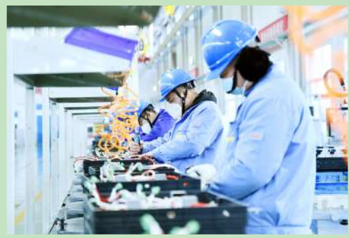
泰开电力电子智能改造项目。