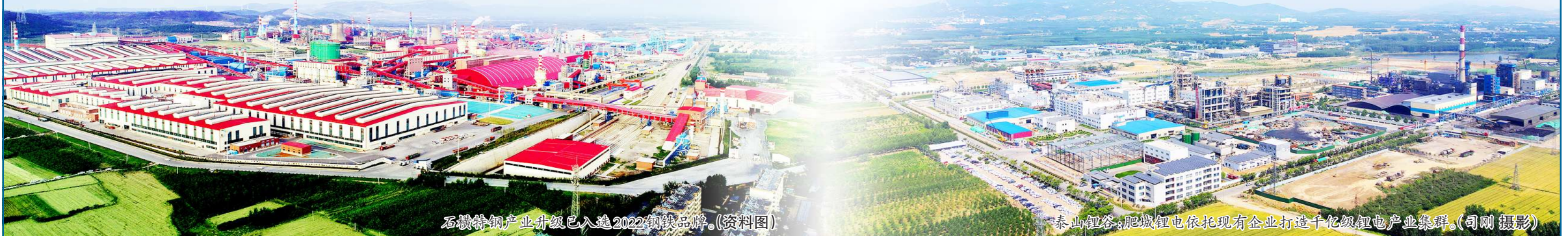
石横特钢产业升级已入选2022钢铁品牌。(资料图)

机制,促进产业创新和科技创新深度融合,梳理确定行业领域“卡脖子”问题开展“揭榜挂帅”,集中支持重大科技成果转化项目,并以开展“百名专家泰安行、百家企业进院所”等活动,搭建起产学研交流合作的平台,协同开展关键核心技术难题攻关、促进科研成果在泰安市转化,不断推动泰安市传统产业转型升级,战略新兴产业持续壮大、未来产业培育布局,助力泰安市经济社会高质量发展。 征程万里风正劲,重任千钧再奋蹄。面对科技革命风起云涌,产业变革趋势如火如荼,泰安市抓住新型工业化建设的难得机遇,创造新需求,开辟新赛道,催生新产业,打造产业发展新生态,以新质生产力引领新一轮的科技革命和产业变革,激发出源源不断的发展活力,挺起高质量发展的“硬脊梁”。