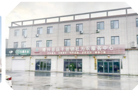
博兴县店子供销社为农服务中心。