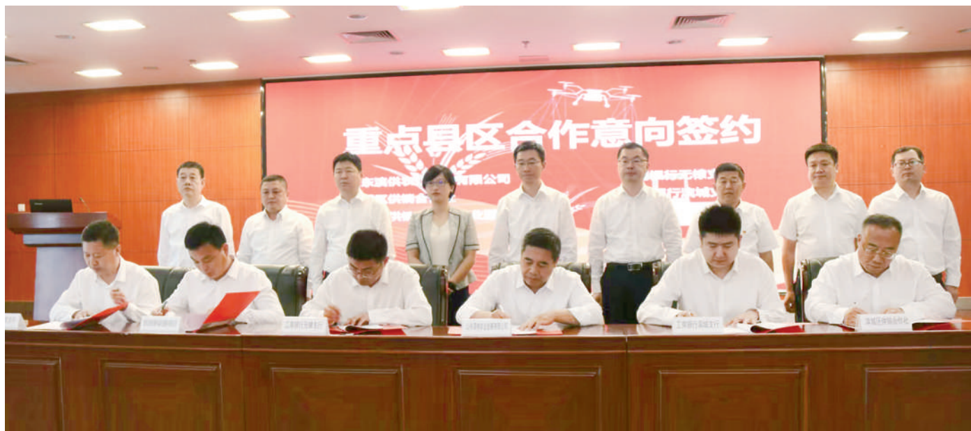
市供销社、工行滨州分行、市融资担保集团联合举行战略合作签约暨滨州供销金融产品发布会。