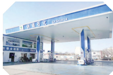
滨城区供销社里则加油站。