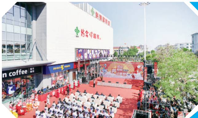
沾化区供销和悦城建成启用。

同时,市供销社聚焦为农服务、商贸流通、农资供应三大主业,深化3项制度改革。滨供农发创新“五级联动”,打造整镇域全程托管试点,实现农民和村集体“双增收”;滨供农服新上日产100吨掺混肥生产线,年供应化肥10万吨;天河商场、益农商贸联合贵阳、仁怀两市供销社,推出“滨供”“社供”等酒水品牌。全市社有企业利润总额达441万元,同比增长324%,真正跑出供销系统改革“加速度”。