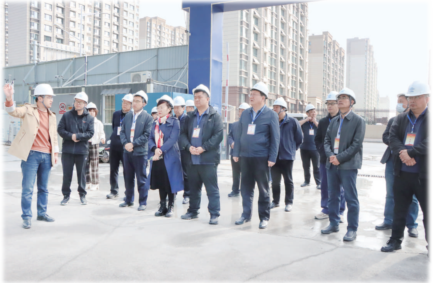
市西街道定期组织人大代表走进项目现场,为项目推进献计献策。