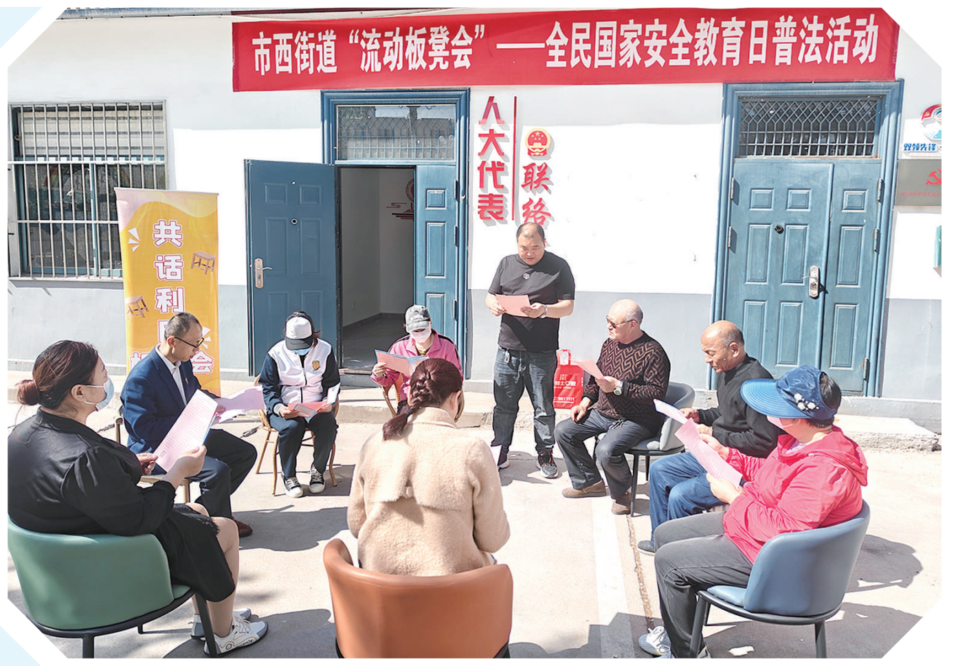
人大代表通过“流动板凳会”为群众普法。