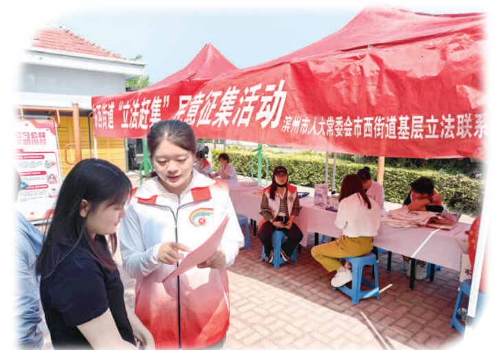
人大代表通过“立法赶集”活动收集群众立法建议。