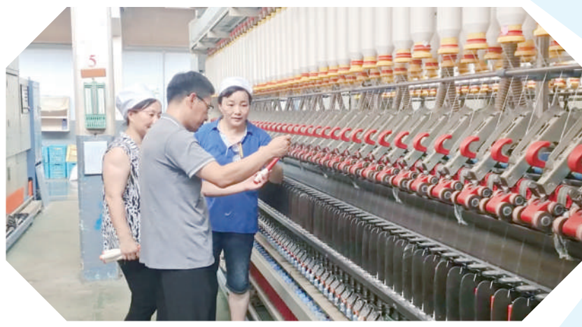
人大代表走进生产车间,了解新技术推广情况。