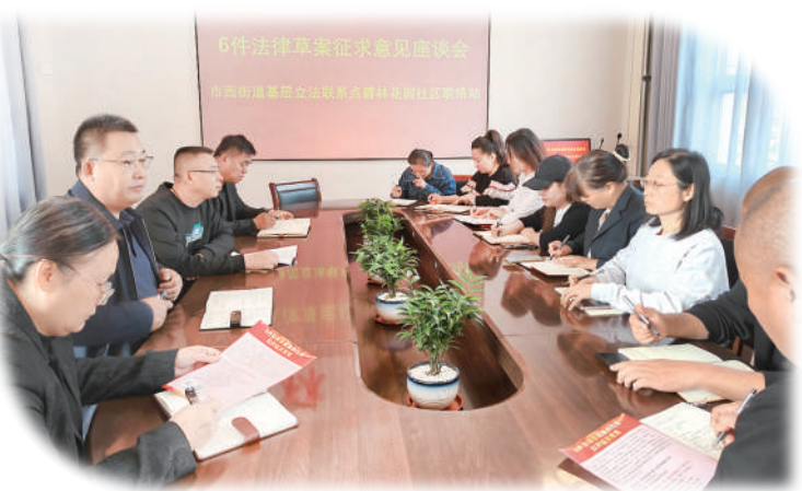
碧林花园基层立法联系点向居民征求立法意见建议。