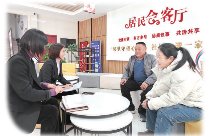
人大代表在居民会客厅倾听群众心声。

市西街道人大工委创立“人大代表调解室”,推动人大代表志愿参与信访矛盾化解工作,解决矛盾纠纷98起;办好“代表三会”,联手打造“有事您找我”协商议事特色品牌,群众提意见建议解决率达98.1%;建立闭环处理机制,将街道智慧联动指挥中心和人大智慧工作有效结合,以12345为民服务热线转办机制、“查访日”动态监测机制、“街长制”城市管理体制3项机制作为辅助补充,形成了“多形式收集整理-多方联动分析研判-多部门协调处理-多渠道公示反馈”闭环处理机制。截至目前,智慧联动指挥平台网格员上报事件4662件,办结率100%;12345热线接收工单4032件,回复率100%,群众满意度96%;人大代表收集意见建议28条,回复率100%,群众满意度100%。此外,各基层立法联系点探索实施“1234”工作模式,把立法联系点工作与学习宣传、执法检查、接待选民、调查研究等与人大其他本职工作相结合,将收集的立法建议与街道协商议事会、村居党员会结合起来,形成“立法意见建议征集地图”,为全市基层立法工作高质量开展提供有利支撑。