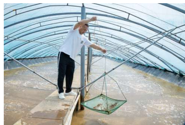
大棚里的盐田虾