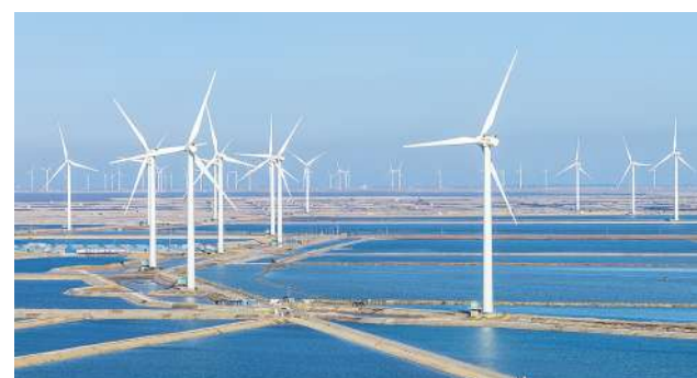
风车森林