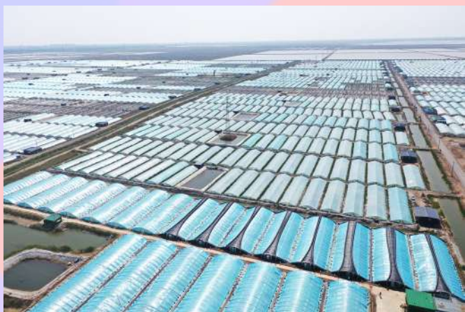
6000亩温棚养虾基地