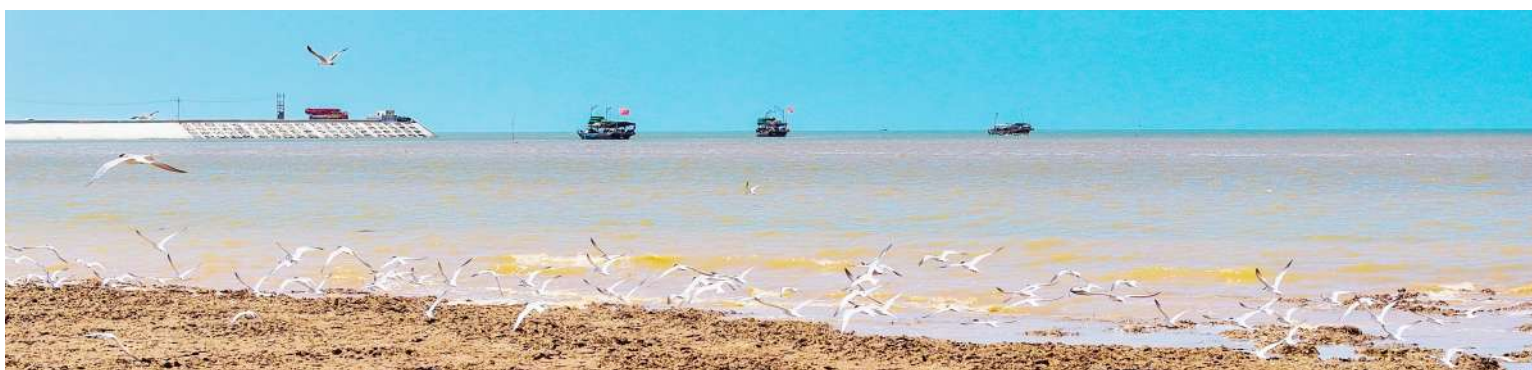
翱翔渤海湾