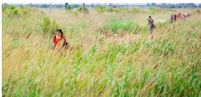
芦苇荡里来采风