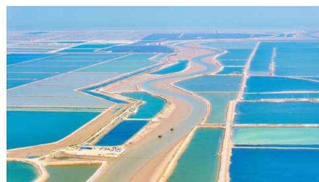
弯弯沟,方方田