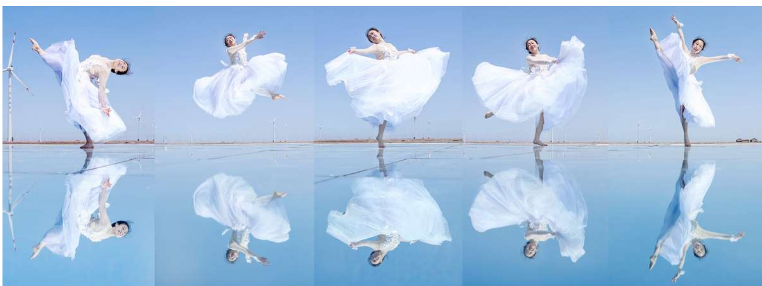
海上芭蕾

通过深化“文化乡建”赋能乡村振兴系列活动,海防办事处以文化为引领,以旅游为驱动,致力打造文化亮点,让更多的人了解海防、走进海防、爱上海防,不断擦亮“渔盐小镇·七彩海防”靓丽名片。