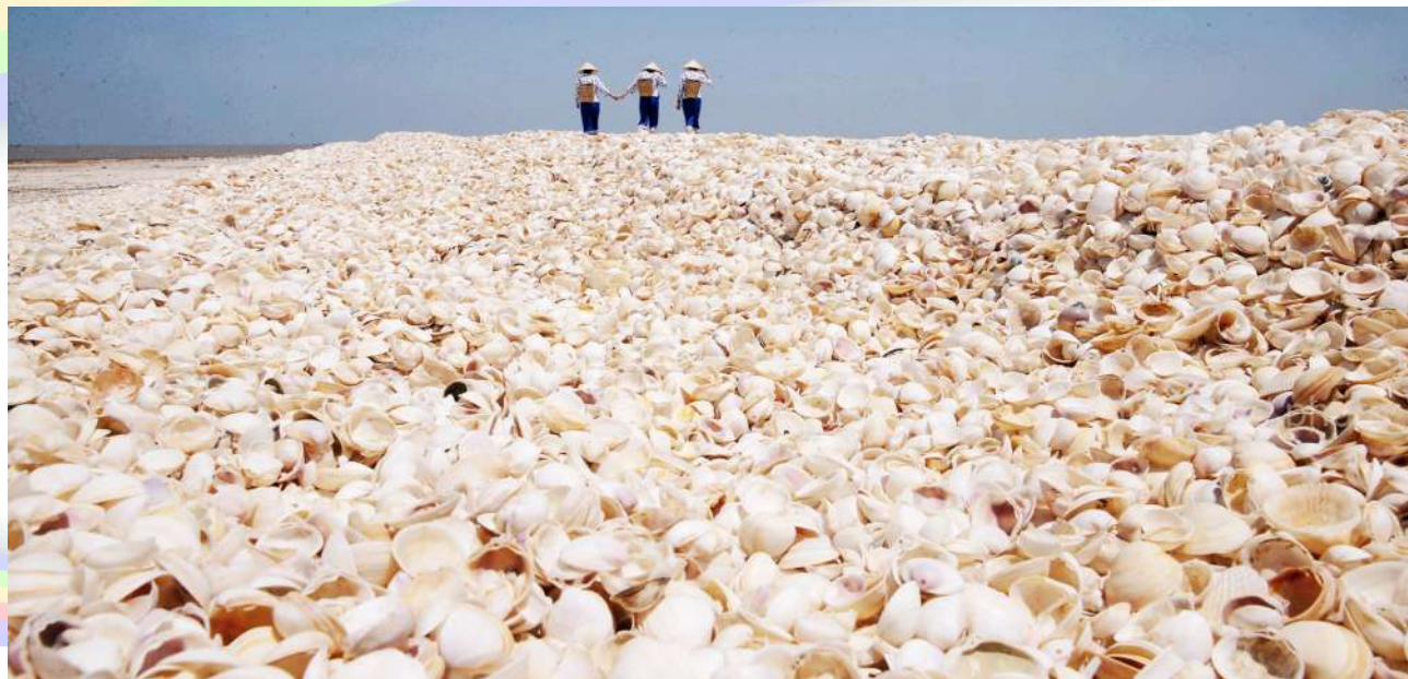
海边有片贝壳堤

沾化区海防办事处位于渤海湾南岸8公里处,辖区版图面积65.5万亩,海域辽阔,渔盐资源丰富,风景如画,人文荟萃。