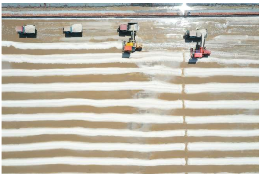
盐田收获季