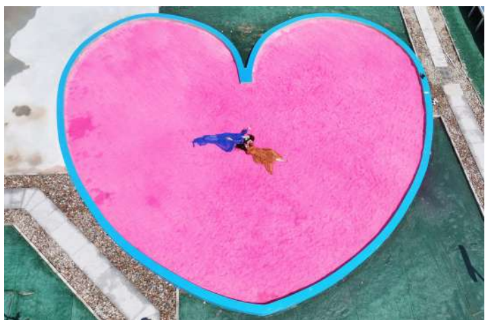
常驻心中