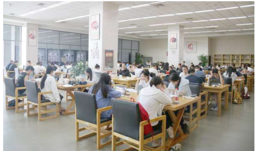
暑期阅览室座无虚席。

为迎接“暑期读书热”,市图书馆优化了空间结构,在三楼东侧精心打造“静音自习室”,新增150个阅览座席,为备考学生和读者提供了一个理想的学习场所。延时开放的新举措,让“上班族”有了更多时间来图书馆借还图书。据统计,自暑期以来,市图书馆(含滨城馆)共接待读者14.8万人次,新注册读者7471人次,较去年实现小幅增长。