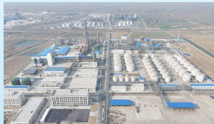
京阳锂电池材料项目。