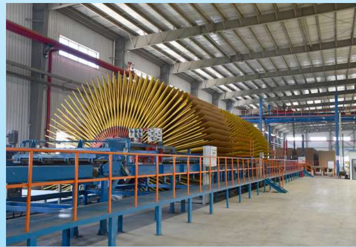
万华无醛纤维板项目。