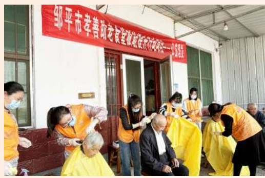
邹平市孝善助老食堂赋能提升行动项目服务团队为64个村的2500余名老年人免费理发。