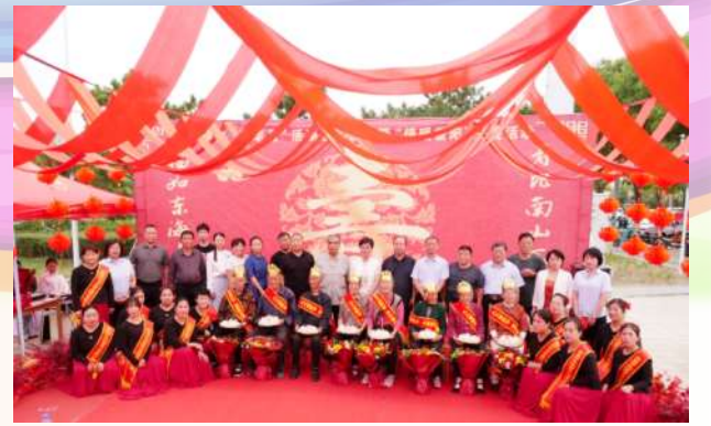
阳信县民政局举办“敬老月启动仪式暨情暖重阳”关爱活动。

批活动”。与此同时,市老龄委各成员单位、各县市区老龄办还推出积分互助服务、健康义诊、“重温经典”频道进养老机构等系列活动,为广大老年人送去关爱。