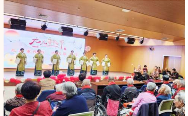
高新区举办“九九重阳节 浓浓敬老情”表演活动。