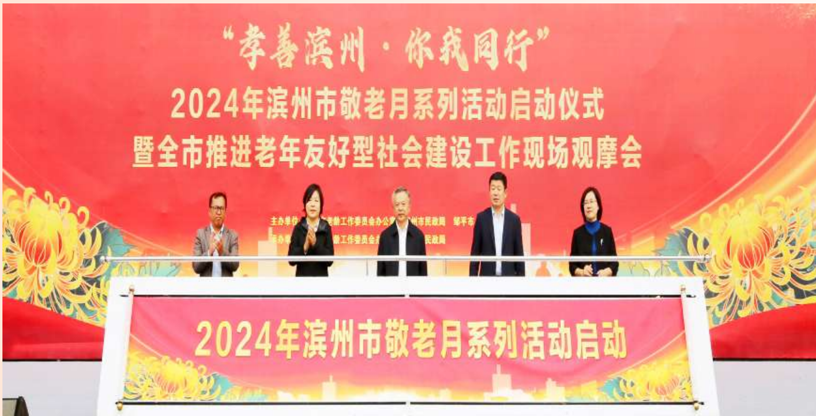
10月9日,“孝善滨州·你我同行”2024年滨州市敬老月系列活动启动仪式暨全市推进老年友好型社会建设工作现场观摩会在邹平市举行。