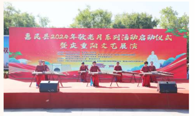
惠民县举行2024年敬老月系列活动启动仪式暨重阳文艺展演活动。