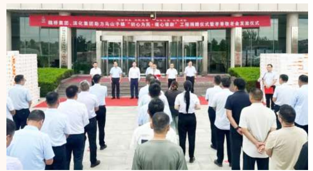
北海经济开发区举办“初心为民·暖心银龄”工程捐赠暨“孝善敬老金”发放启动仪式。