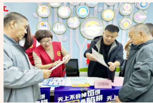
无棣县举办“敬老月”活动启动仪式暨棣丰街道暖心家园“庆国庆·迎重阳”慰问演出活动,同时开展非法集资宣传、为老服务咨询、健康义诊等活动。