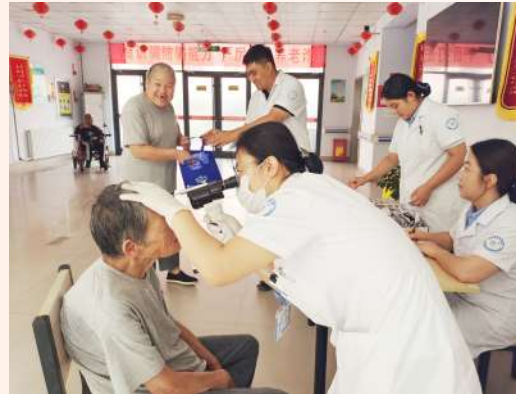
滨州经济技术开发区联合欣视洁眼科医院视光中心,为敬老院老年人免费义诊。