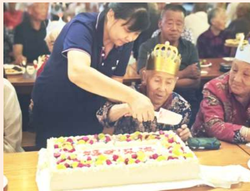
博兴县博华老年公寓为百余位寿星举办集体生日宴。