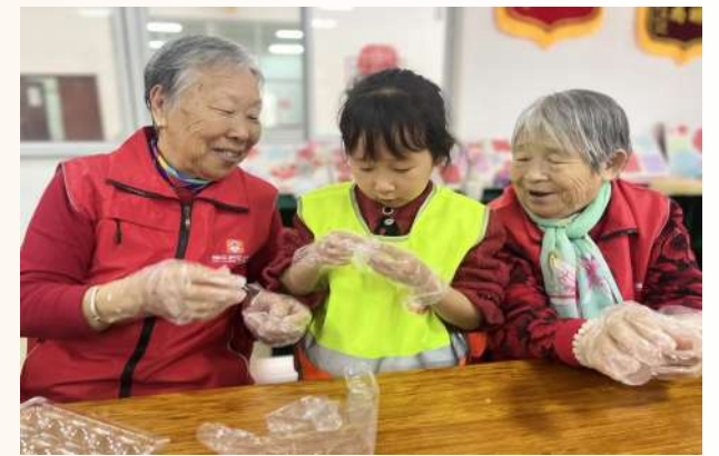
博兴县开展敬老月探访关爱活动。