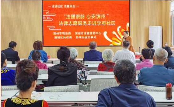
滨城区举办法律志愿服务进社区活动。