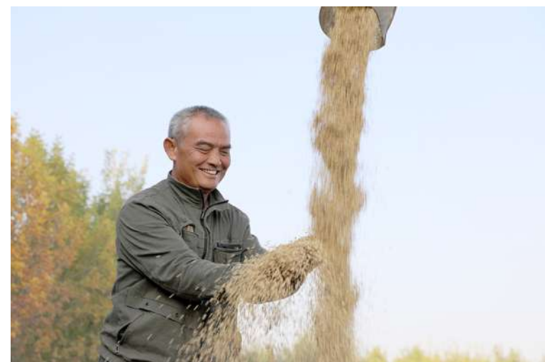
10月23日,在博兴县乔庄镇榆林村,村民在查看收获的水稻。当日是秋季的最后一个节气霜降,农民抢抓农时在田间地头忙秋收、秋管等工作。