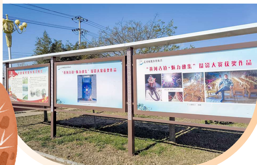
“黄河古镇·魅力魏集”摄影展现场。