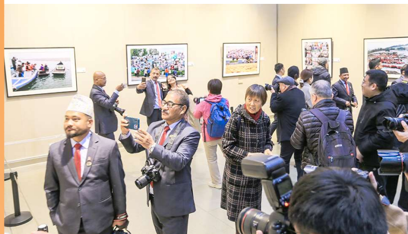
主展区共展出120余件优秀摄影作品和视频作品。