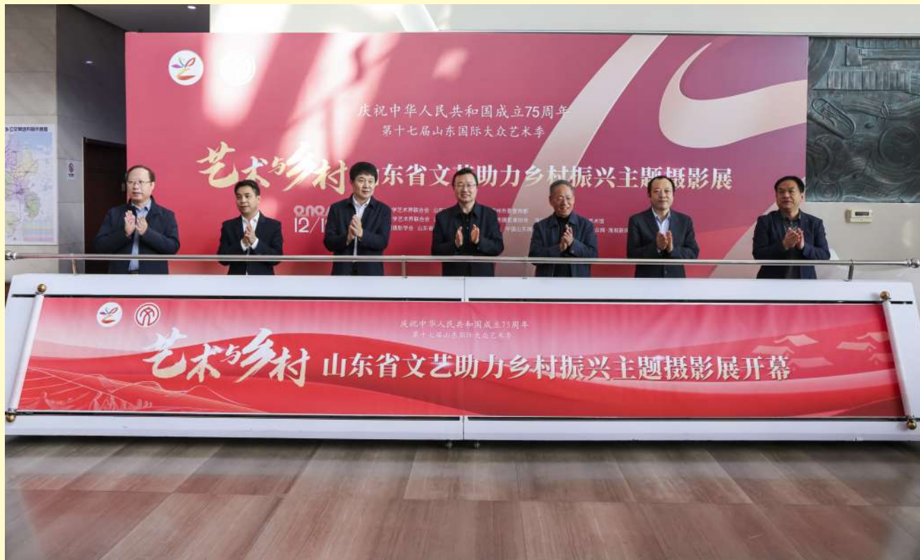
嘉宾领导共同启动山东省文艺助力乡村振兴主题摄影展。