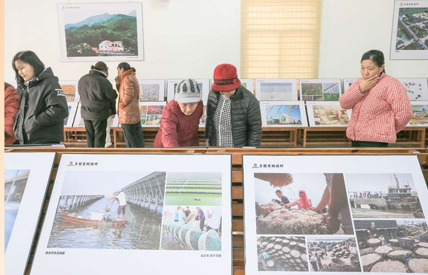
村民们在杨柳雪村驻足观看“乡村里的滨州”摄影展作品。