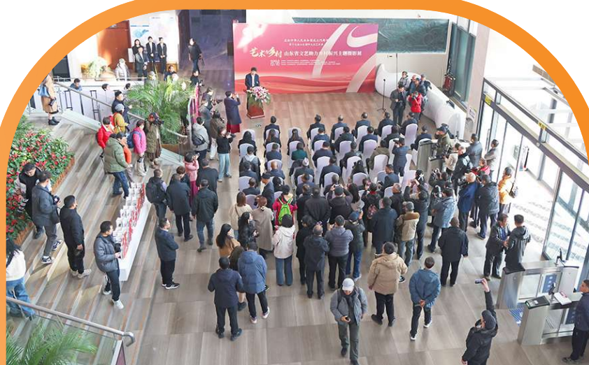
“艺术与乡村”山东省文艺助力乡村振兴主题摄影展开幕式现场。