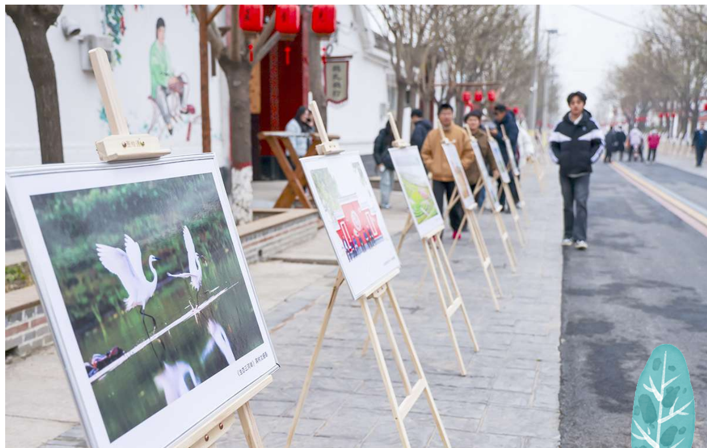
“河湖胜境·金秋农家”摄影展在三河湖镇王素先村同步开展。

“本次摄影展在滨州举办，不仅是对齐鲁乡村振兴的光影记录，更是一场激励全社会共同关注、助力乡村振兴的文化号召。”山东省摄影家协会主席范长国说：“山东省摄影家协会将以此次展览为契机，进一步引导广大摄影人深入乡村生活，用光影讲述更多动人的山东故事，用镜头呈现更多鲜活的振兴画卷。”