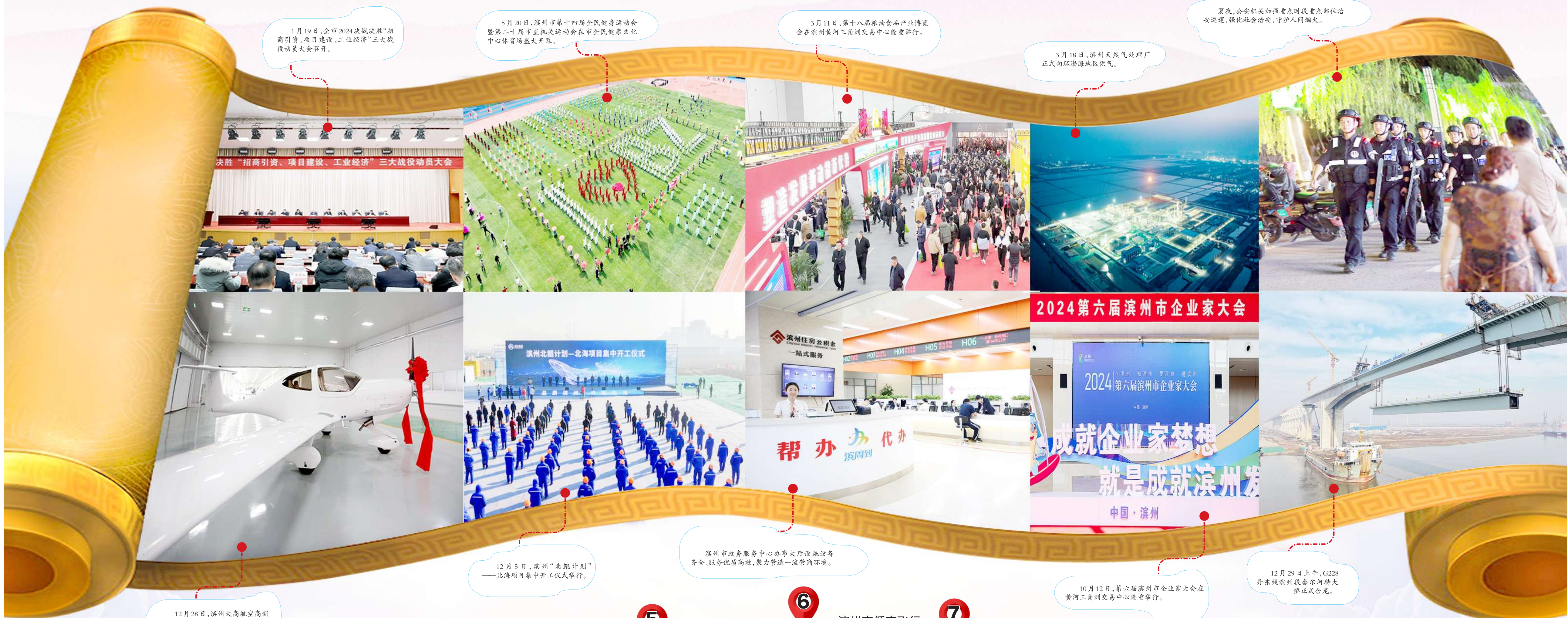
1月19日,全市2024决战决胜“招商引资、项目建设、工业经济”三大战役动员大会召开。