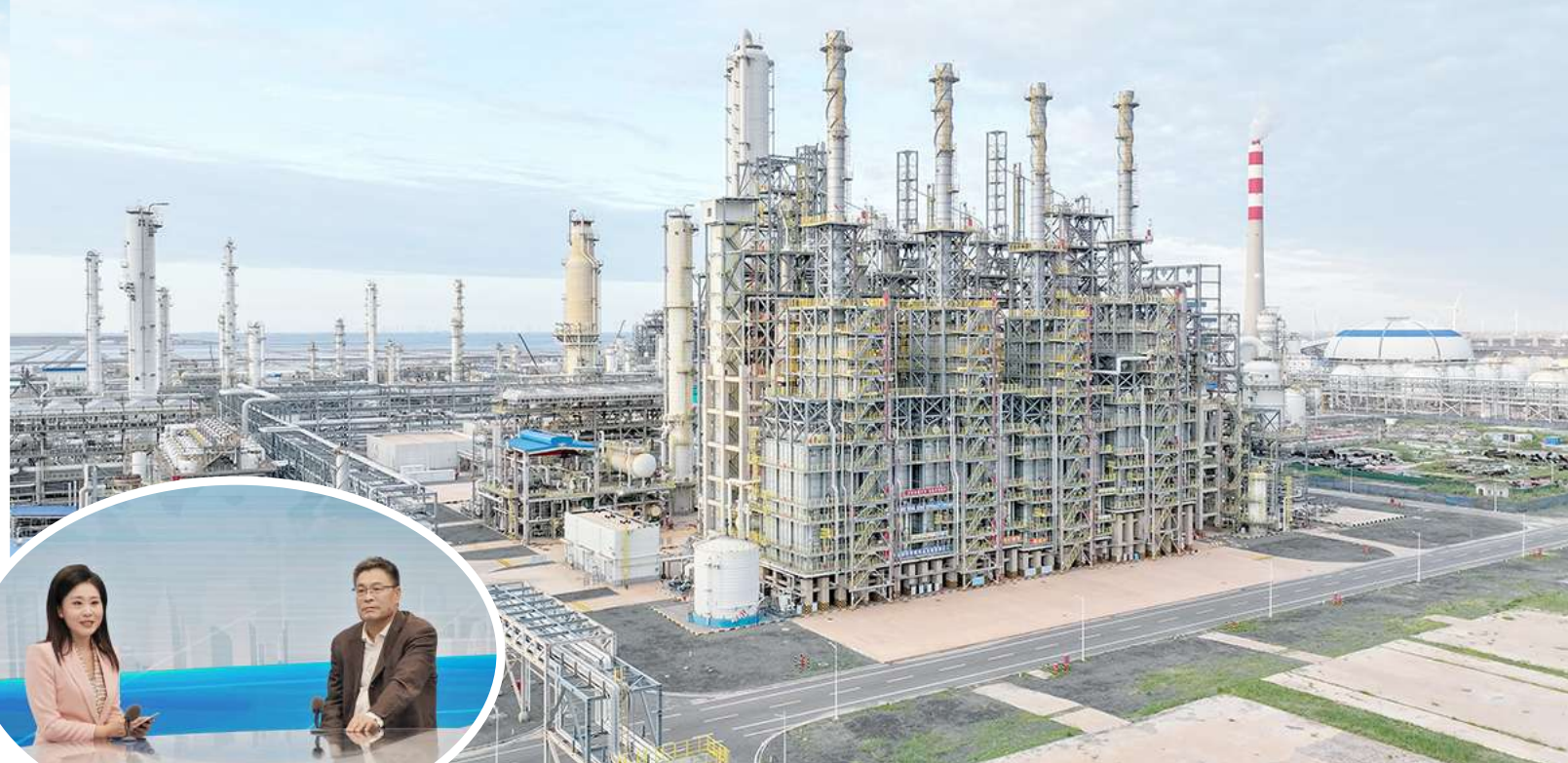
碳三碳四综合利用项目。

文精神”双核驱动,秉持以人为本理念,精心雕琢“幸福滨化”蓝图。近年来,各类员工激励计划、TUP计划、员工幸福里提升项目纷至沓来;中高考陪考假、父母生日假温情落地;寒暑假子女托管服务贴心上线;重要节假日慰问离退休职工及困难群体成为常态。2024年年初,“百万医疗保障基金”“员工子女救助基金”暖心设立,全力为员工提供坚实后盾,厚植员工幸福感、获得感、成就感。爱心不止于企业内部,辐射周边教育领域亦是毫不余力。岱尖小学在项目驻地,2020年英语教师离岗至教学困境,滨化集团自发组建义务支教队驰援;此后,教学环境修缮、图书器材添置有序推进;借助寒暑假,带领孩子走出偏远渔村,奔赴科技馆、爱国主义教育基地等,拓宽视野;设立助学点,启动“小荷计划”“八一工程”“春霖行动”,选派优秀员工支教,帮扶贫困学生,点滴善举照亮孩子求学之路。