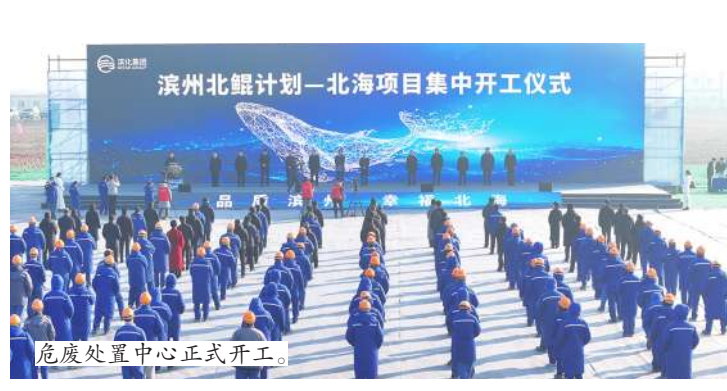
危废处置中心正式开工。

在这场深度对话中,我们领略滨化集团多元风采:前瞻性战略布局、稳健项目推进、暖心社会责任、厚植员工幸福。相信未来,滨化集团定将秉持创新、担当、博爱的精神底蕴,续写化工行业传奇,持续赋能滨州经济社会高质量发展,携手滨州同赴辉煌。