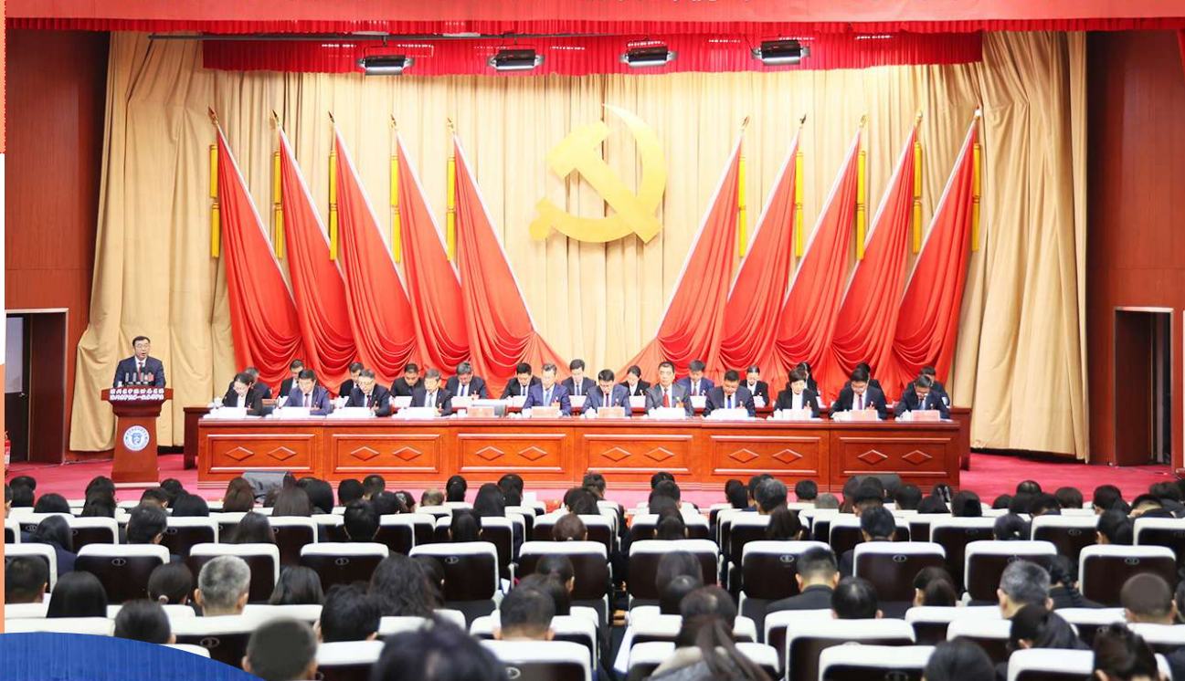
胜利召开第四次党员代表大会。