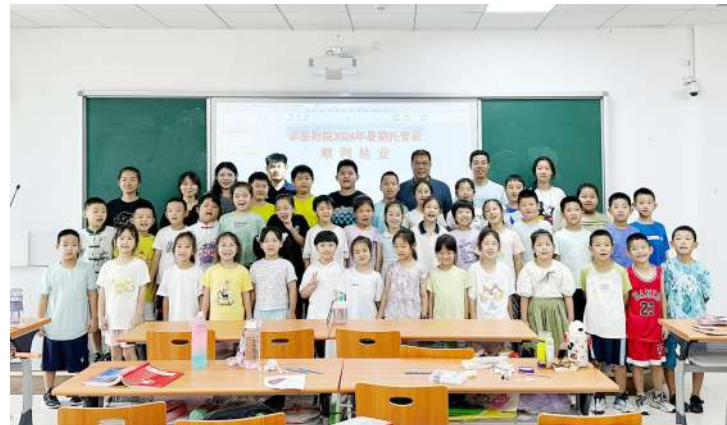
开办职工子女暑期公益托管班。