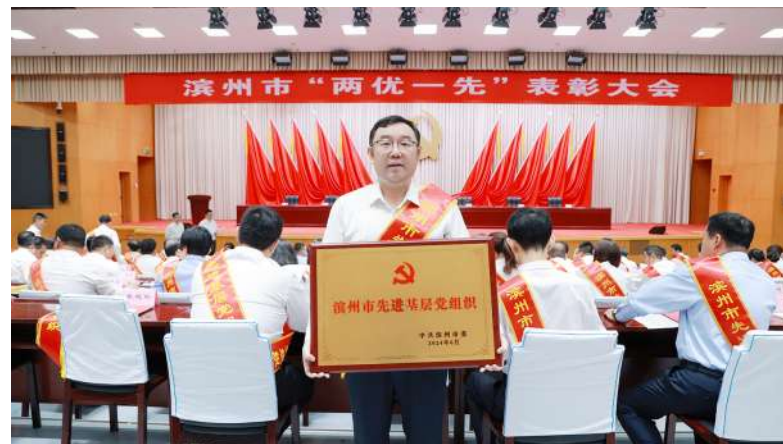
滨医附院获评“滨州市先进基层党组织”荣誉。