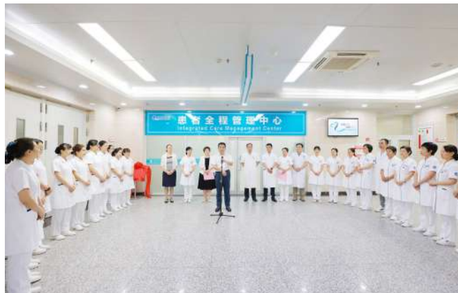
成立患者全程管理中心。