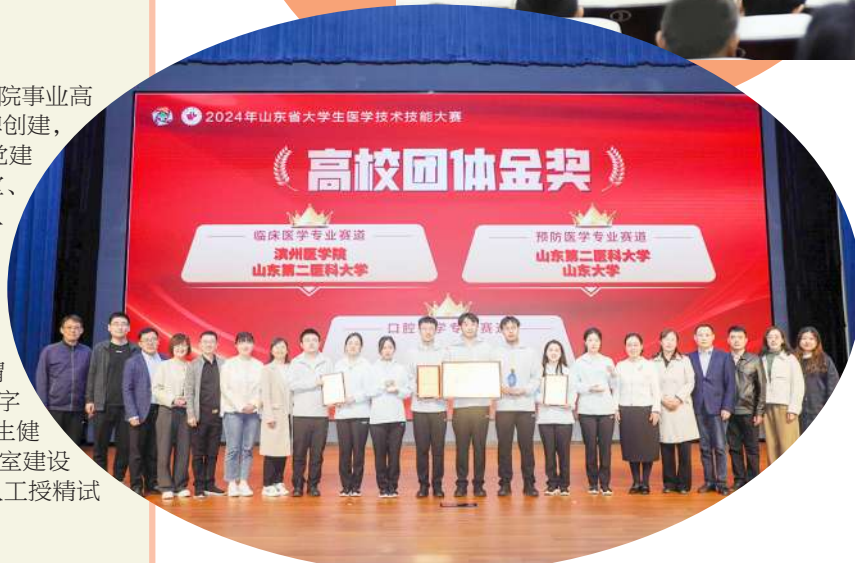
启智润心,人才培养成效显著提升。