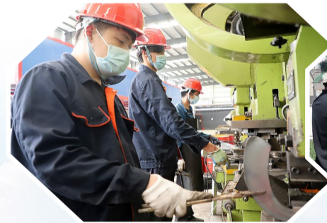
山东圣大农业设备有限公司生产车间内工人赶制订单。