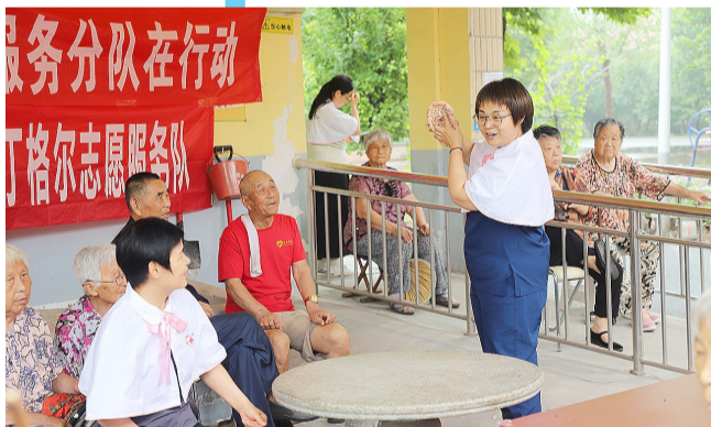
南丁格尔护理志愿服务队走进敬老院，为老人送去“三伏天”暖心服务。

2024年以来，邹平市明集镇聚焦经济发展、乡村振兴、基层治理、民生改善等领域，坚定不移拼经济、稳增长、惠民生、保稳定，书写了明集镇高质量发展新篇章。