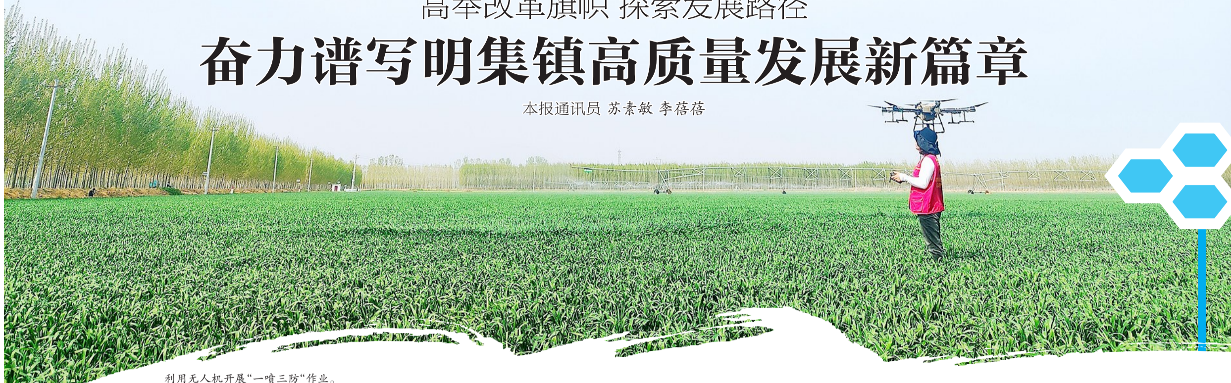
利用无人机开展“一喷三防”作业。