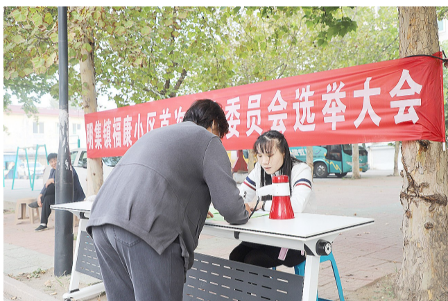
成立镇级“红色业委会”。