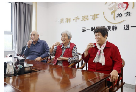
建立村级特色调解茶室。