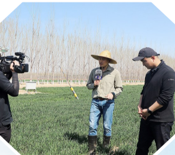
数字农业相关做法连续多次被央视、新华社等中央媒体深入报道。