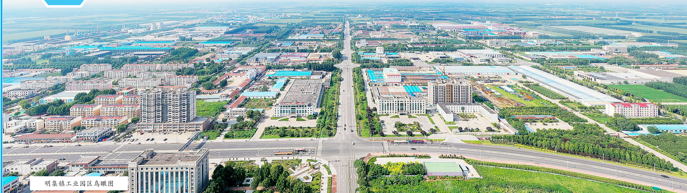
明集镇工业园区鸟瞰图