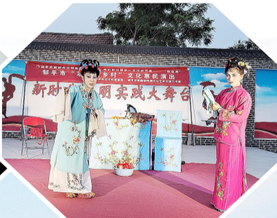
开展送戏下乡活动，丰富群众文化生活。