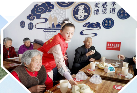
孝善食堂内志愿者为老人服务。