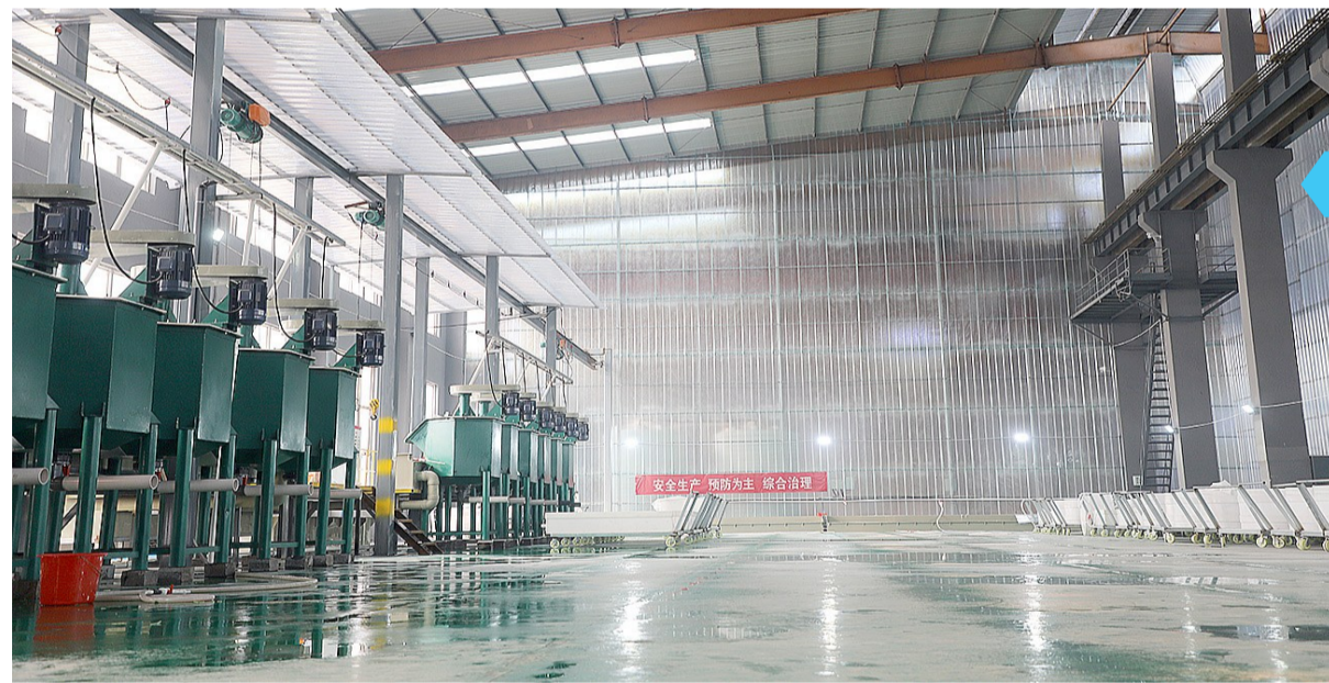
将闲置厂房改造成标准化生产车间。

坚持“人民至上”，民生幸福指数不断攀升。聚焦“镇村品质提升”工作主线，全域开展“一清一补”专项行动，以实干实绩提升镇村“颜值内涵”。投资300余万元实施老旧小区供暖改造项目，完成9个小区供暖站点提升改造，确保群众温暖过冬。积极推进全镇14处幸福院和4处孝善食堂规范化运营，常态化开展“上门剪发”“上门问诊”等志愿服务活动，营造孝老爱亲浓厚氛围。深入贯彻“教育为本”理念，投资130余万元提档明集中学、明集一小校舍、教具等硬件设施，为学生提供更加优质教育教学条件。明集中学教学水平继续领跑。持续推进卫生院口腔、康复、中医三大特色诊室品牌建设，成立家庭医生服务队9支，完成签约5300余人次，开展公共卫生查体5200余人次，让群众在家门口享受优质诊疗服务。