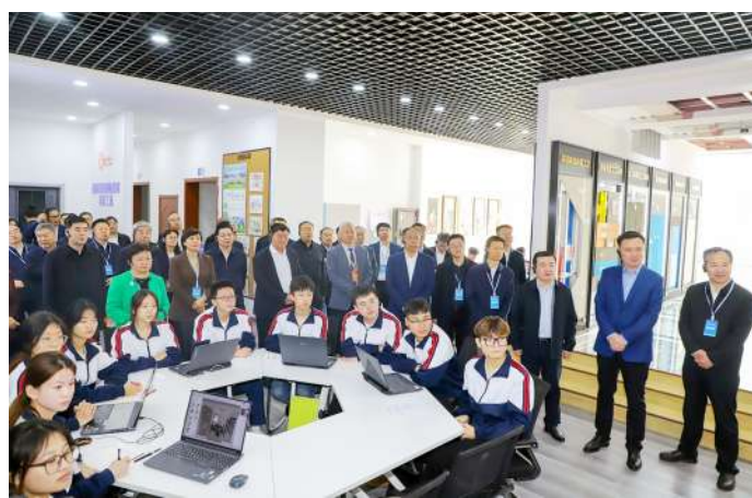
承办山东省首次职业院校高质量教学现场交流活动。

立项教育部人文社科项目1项、省自然科学基金项目3项、省重点研发计划项目1项、省部级课题42项,省自然科学基金立项数和资助额实现历史性突破。立项省级科研创新平台4个,省社科规划项目1项,省教育科学规划重点课题2项,位列全省职业院校第一。入选省哲学社会科学青年人才团队、市级特派员产业服务团队各1个。获批科技成果奖31项,授权发明专利13项。合作成立滨州市民营企业发展研究中心、企业合规研究院。入选全省高校“百校万企万师双进”行动首批试点高校,服务企业100家,为企业解决技术难题100余项。科研与社会服务竞争力排名全国第16位,全省第一。