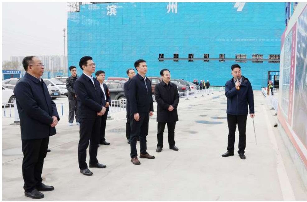
市委副书记、市长李春田到校调研南校区建设情况。