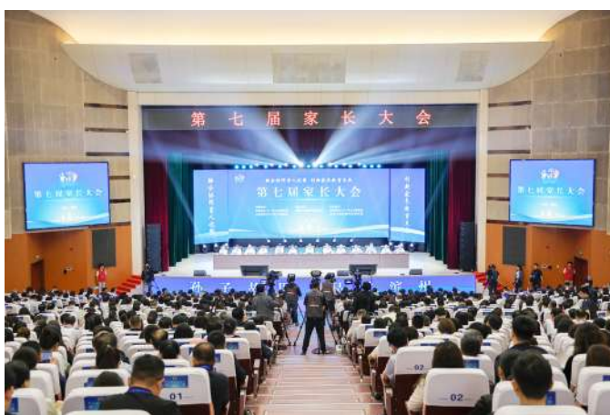
第七届家长大会在滨职开幕。

实施高质量人才引育工程,引进高层次人才30人,博士达74人。1名教师获全国五一劳动奖章。获评省优秀教师、省技术技能大师、省青年技能名师各1人。