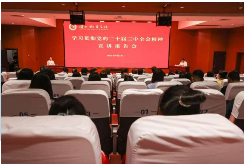
举办学习贯彻党的二十届三中全会精神宣讲报告会。