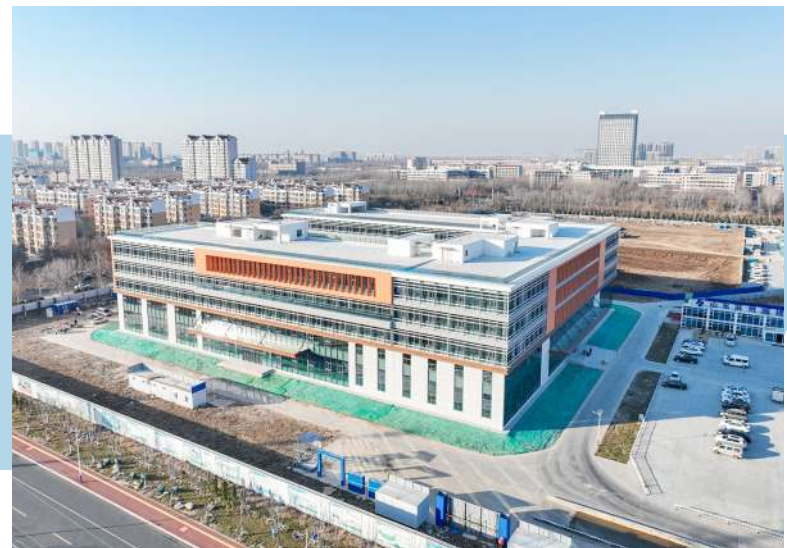
黄河三角洲智能制造产教融合基地完工。