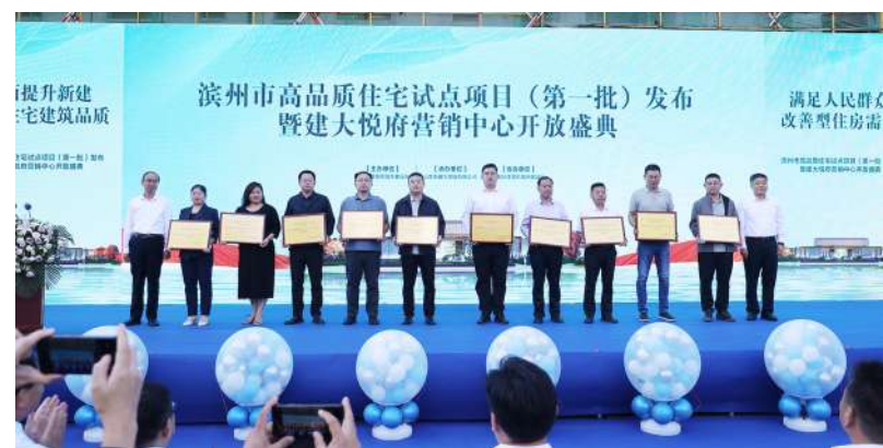
发布滨州市高品质住宅项目(第一批)。