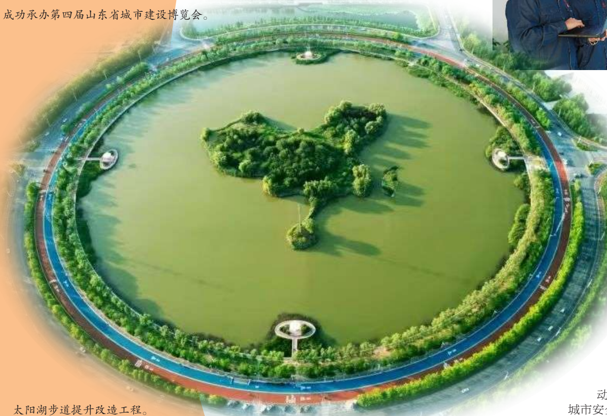
太阳湖步道提升改造工程。

13 成功盘活原龙悦国际饭店烂尾楼,建设的滨州中心项目竣工投用。《城市“伤疤”化身城市新地标》入选滨州市“依法有法办、有法依法办”典型案例,相关工作经验获中国建设报等国家级媒体刊发。