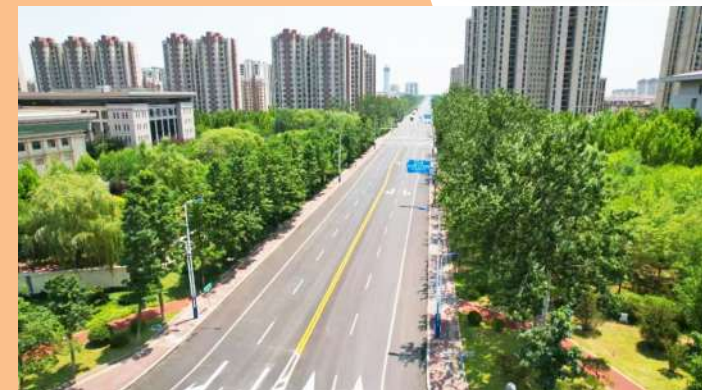
渤海十三路道路提升改造工程。