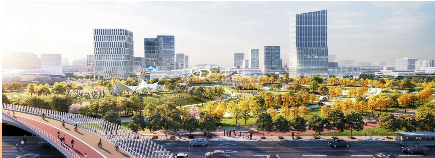
高铁片区中轴效果图。