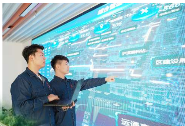
供热信息管理平台。