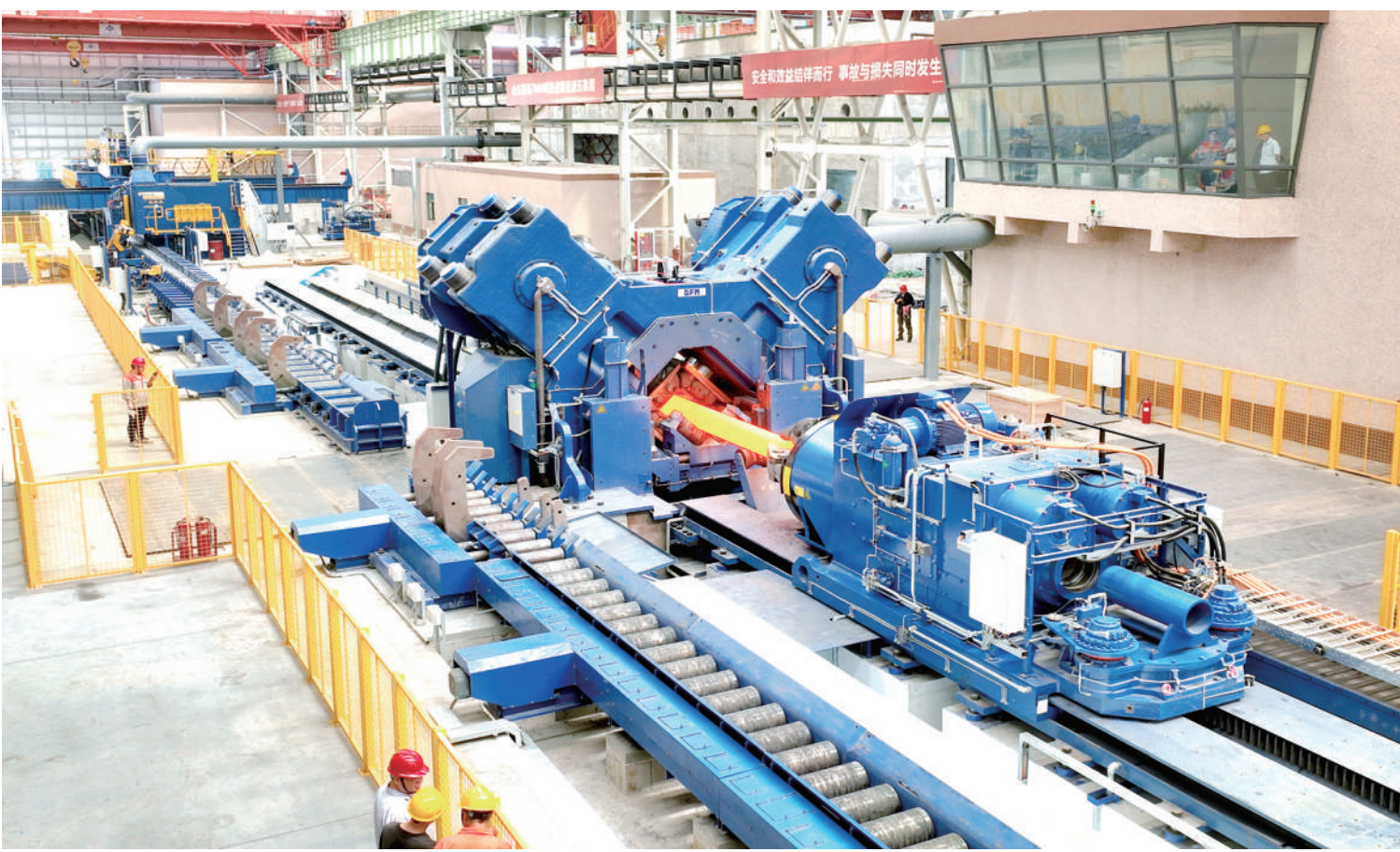
山东广富集团琳海年产20万吨锻件项目生产现场。

“响鼓重锤”开新局,“满弓紧弦”定成势。一个项目就是一个新的经济增长点,青阳镇将大力落实重点项目服务保障机制,奋力推动项目建设提质增效,持续推动经济社会发展再创佳绩。