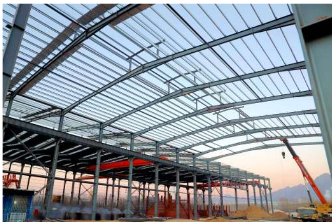
山东上佳宜金属制品有限公司项目建设现场。