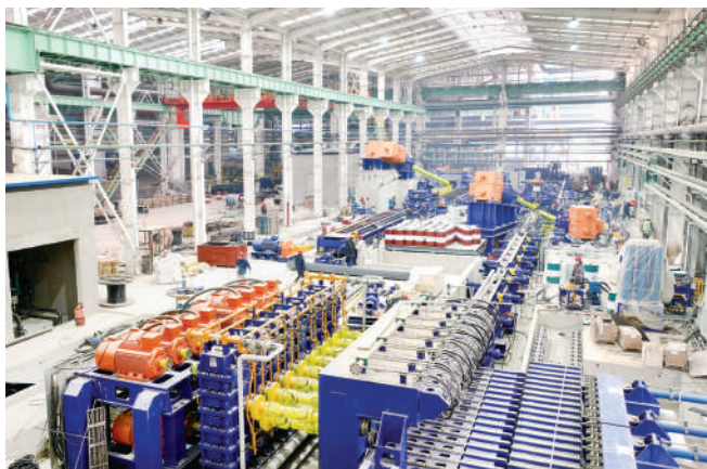
海宇新材料产品高端化升级改造项目进入设备安装和调试阶段。