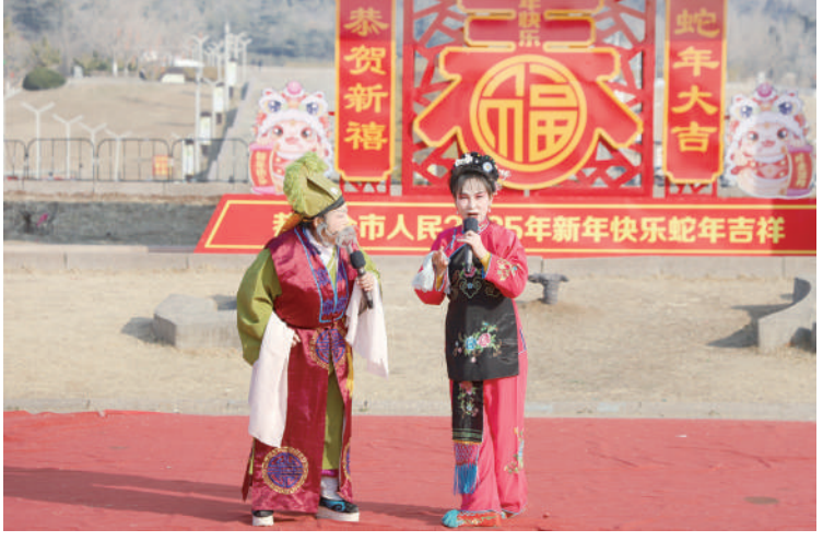
邹平市明集镇开展元宵节文艺惠民活动。戏曲、锣鼓、歌舞、二人转等精彩节目轮番上演,丰富了群众文化生活,让大家感受到了浓浓的节日氛围。