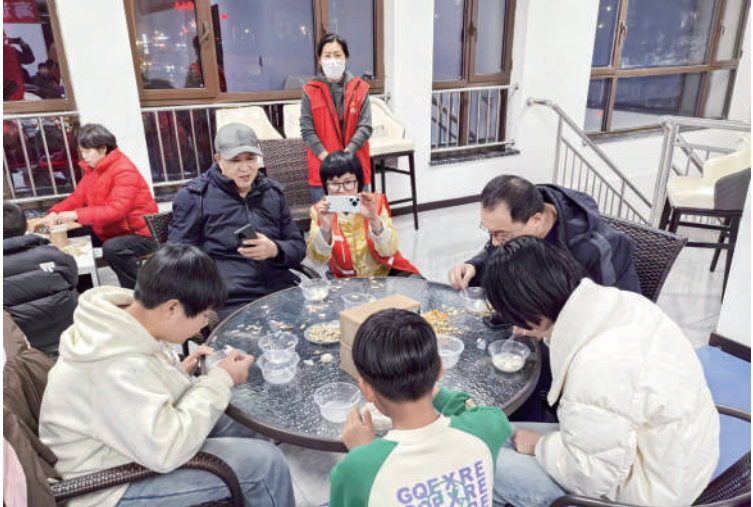
博兴县博昌街道东风社区在海通·博悦府小区开展“浓情元宵”睦邻活动。居民们一起吃元宵,沉浸在浓浓的节日氛围当中。