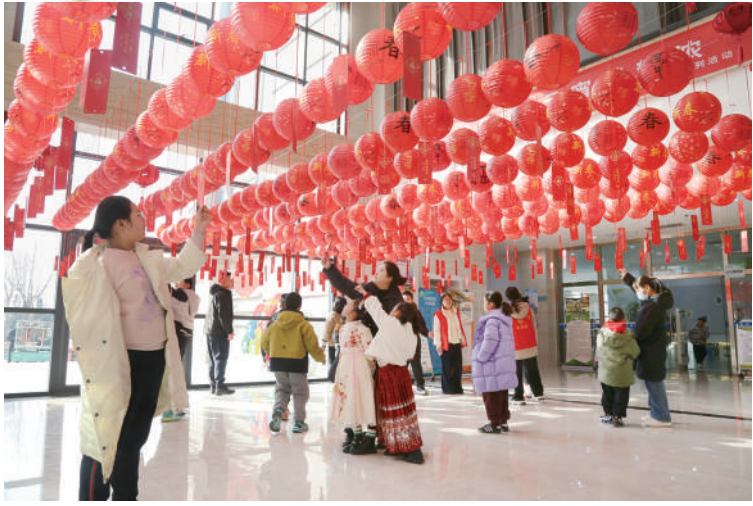
2月12日是元宵节,沾化区图书馆组织开展了“蛇岁书香绕元宵灯谜韵浓”元宵节猜灯谜活动,让广大市民沉浸式感受喜庆节日氛围和民俗文化魅力。