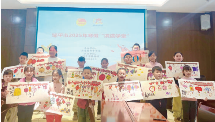
邹平团市委在“滨滨学堂”开展了“年画映元宵”主题活动。孩子们在志愿者的指导下,画出了大红灯笼等作品,在一笔一画中感受民俗文化内涵。