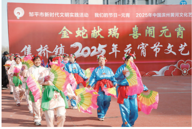
2月12日元宵节当天,邹平市焦桥镇举办了“金蛇献瑞 喜闹元宵”2025年元宵节文艺汇演。文艺爱好者们表演了扭秧歌、跑小驴、抬花轿等精彩节目,为人民群众奉献了一场节日文化盛宴。