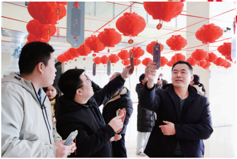
近日,邹平市韩店镇组织开展了“猜灯谜 闹元宵 过佳节”活动。活动现场悬挂着上百个红色花灯和灯谜,吸引了干部职工纷纷前来猜灯谜,营造了文明、喜庆的节日氛围。