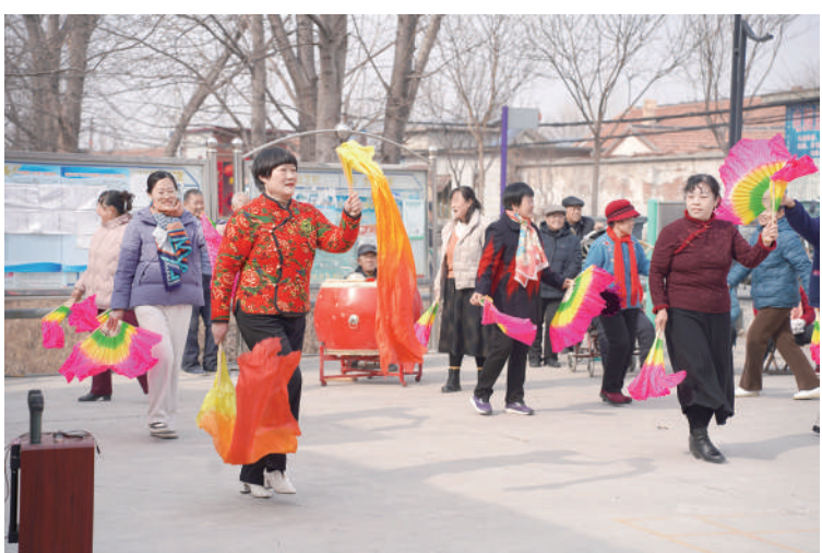
高新区小营街道董川村举办2025年新春元宵喜乐会。村民们自编自演了大秧歌、诗朗诵、歌舞等精彩节目,营造了欢乐、祥和、喜庆、热烈的节日氛围。