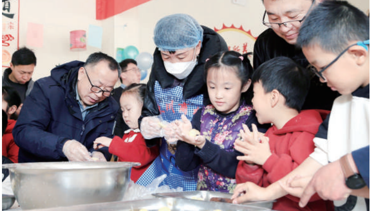
在无棣县馨棣社区活动室里,观看曲艺节目,老少同乐,欢庆元宵佳节。县政协委员、社区工作人员、孤寡老人、孩子们一起做元宵、猜灯谜。