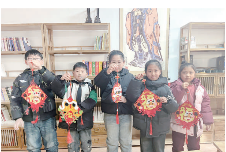
无棣县水湾镇新时代文明实践所联合“滨滨学堂”、“益起学”蒲公英课堂开展元宵节主题活动。志愿者指导孩子们制作“醒狮”灯笼等多种手工艺品,营造浓浓的节日文化氛围。