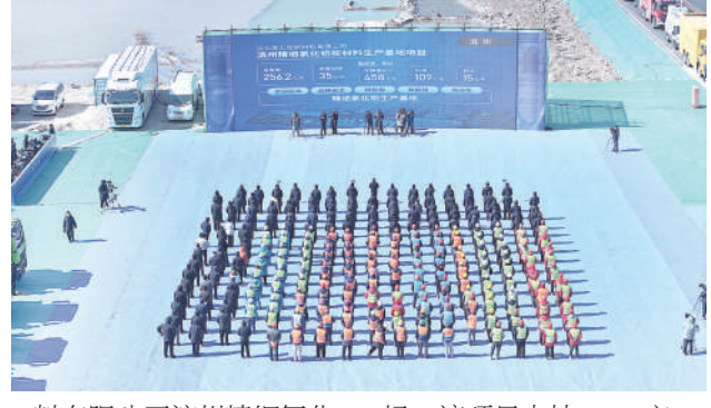
料有限公司滨州精细氧化铝新材料生产基地项目现场。该项目占地4507亩,总投资256.2亿元,全部建

成后氧化铝产能达到800万吨、精细氧化铝产能突破100万吨。该项目首次采用智能全自动化控制系统,选用大型节能自动化设备,依托魏桥创业集团800万吨氧化铝生产线,建成后将成为全国最大、品种最全的绿色化、智能化、高端化精细氧化铝生产基地,带动传统铝行业向多用途氧化铝新材料产业延伸,加快建设“铝基材料名城”。