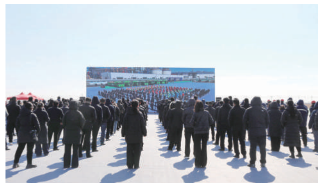
动浇注机等全球顶尖设备,可实现机器人自动识别、自动抓取等全自动化生产运行。目前,该项目正

此次开工仪式设在惠宇汽车零部件有限公司年产20万吨高端精密刹车盘智能制造项目现场,该项目总投资52亿元,属于“十强”“四新”产业,配备了自