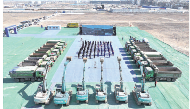
化利用项目现场。该项目总投资14.5亿元,占地500亩,是国家级特殊危险废物集中处置中心、全

省唯一废盐处置中心、“北鲲计划”标志性项目。该项目具有显著的社会效益和生态环保效益,通过“废盐处置+盐业利用”,推动氯碱产业绿色循环发展,为我市高端化工新材料产业集群发展提供强力支撑。