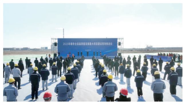
5万吨污水处理、8万千瓦热电联产等打基础、利长

无棣县此次集中开工的项目既有源海新材料、创源氢氧化铝、海生绿色化技改等投资规模大、带动能力强的大项目、好项目,又有新能源汽车充电、