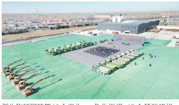
源生物环糊精等19个产业类项目达产后,将推动产业加快向高端化、智能化、绿色化迈进;15个基础建设项目将全面提升民生保障水平,为高质量发展筑牢

博兴县此次开工项目涵盖新能源、新材料等多个领域。旺岛出口型高端高强新材料、博兴智慧粮仓等8个省、市重点项目建成后,将进一步完善产业配套体系;恒瑞出口型板材、智