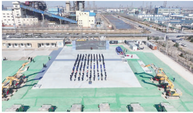
实施的重点项目,总投资 30.6亿元,新上生产线11

滨城区项目集中开工仪式分会场设在九环新越新能源科技股份有限公司九环新越新材料产业基地建设项目现场。该项目是在拆除老厂区基础上