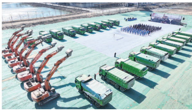
比66.7%;总投资53.5亿元的18个项目实现当年开

据了解,阳信县此次集中开工的重点项目中包含新能源新材料、精细化工等产业类项目24个,占