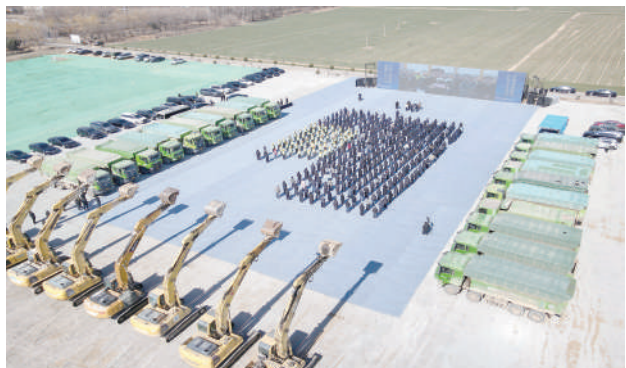
延链项目,覆盖3C电子、轨道交通、新能源汽车零部件生产等领域,是邹平打造的另一个百亿级铝深加工

邹平绿色低碳高端铝产业园紧邻创新50万吨再生铝项目,新建38万平方米标准厂房,利用优质再生铝水,建设10个铝深加工